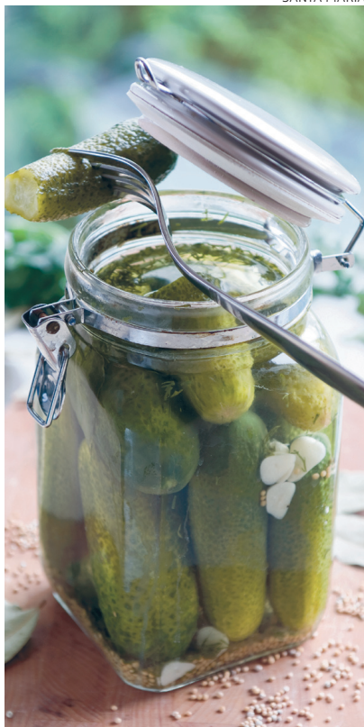
Värskelt marineeritud kurgid küüslau- gu ja sinepiseemnetega.