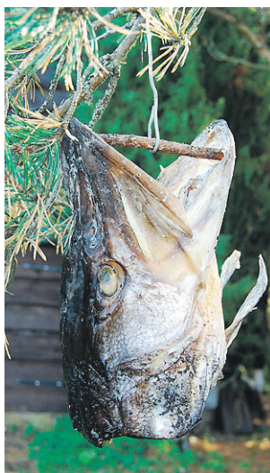
► Kohaliku mere hirsad elukad: tegelikult haugipea.