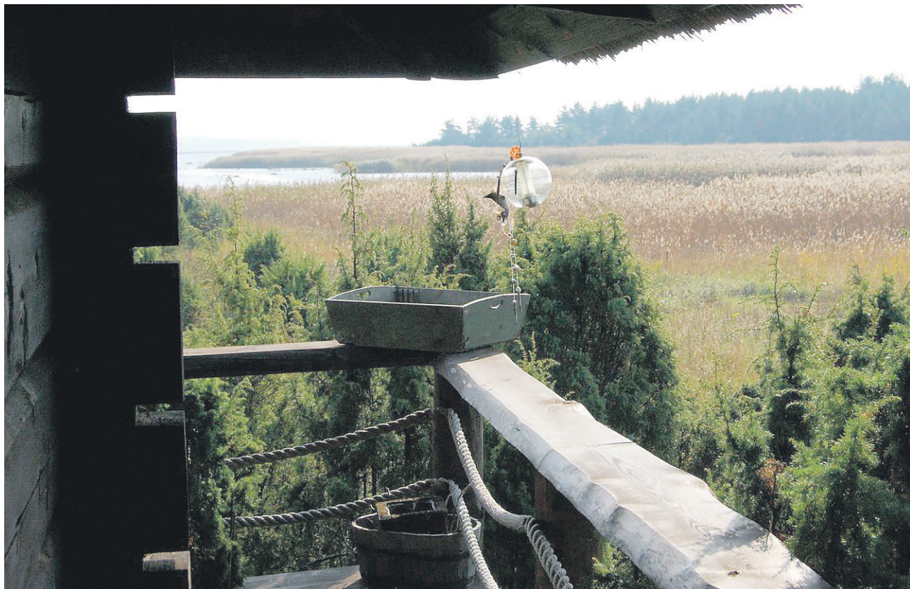
► Merevaadet saab nautida nii avaratest akendest kui ka kolmest küljest maja ümbritsevalt terrassilt.

kordne omanäolise ehitise otsingutee. Pealegi on kohal kena kõlaga nimi – Hõbesalu.