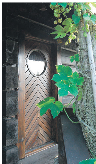
► Humalad, köied ja illuminaatori kujuga ukseaken.

Nimelt pääseb majakese juurde üle silla, mis ületab