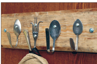
Vanadest lusikatest meisterdatud nagi.

Tulemuseks on lambikuppel või hoopis küpsisevaagen. Kui rohkem vaeva näha, võib teha ka seinakella kosta. Pärast tuleb vorm mõistagi viia kellasessa juurde, kes sinna sisse kella sisu asetab ja seierid paika sätib. Tulemuseks on stiilne ja omapärane ajanaätaja.