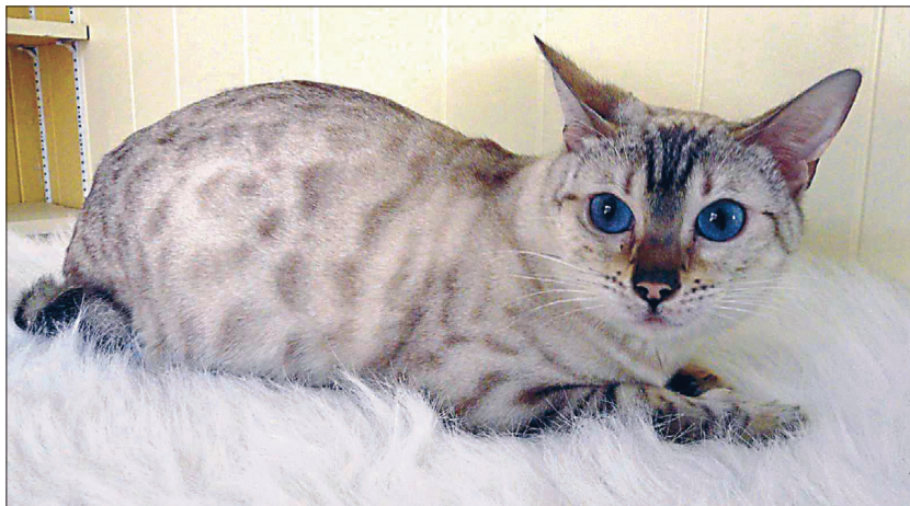
Bengali kass – nagu väike leopard.

Allikas: www.buzzle.com/articles/white-cat-breeds.html , Wikipedia