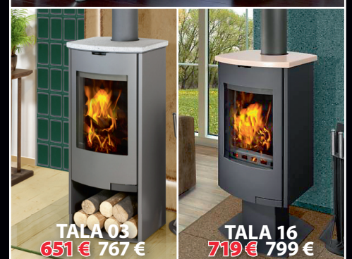
TALA 03 651 € 767 €