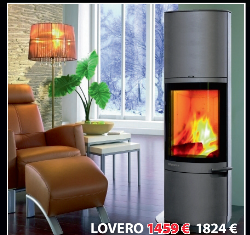
LOVERO 1459 € 1824 €