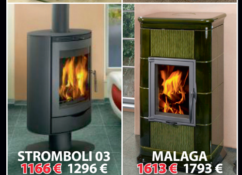
STROMBOLI 03 1166 € 1296 €