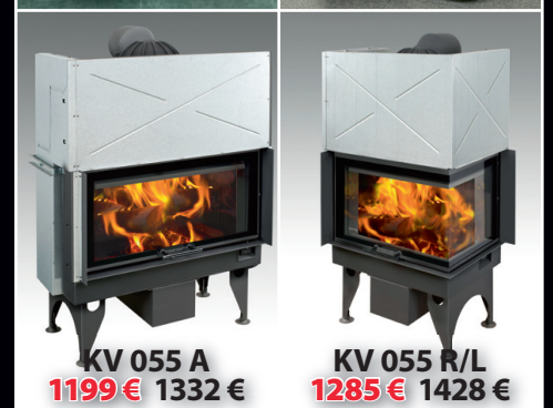
KV 055 A 1199 € 1332 €