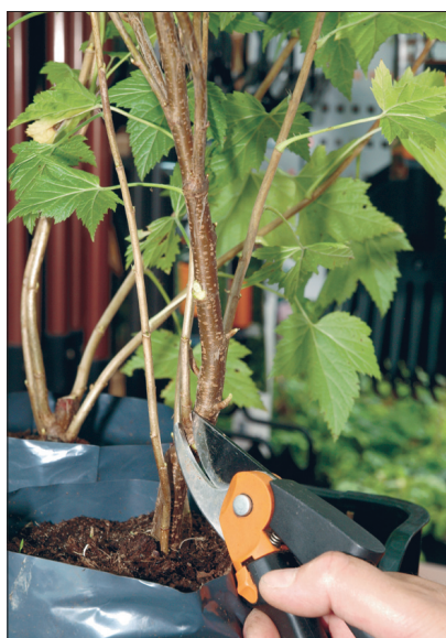
Liiga tihe istik. Eemaldage sissepoole kasvav oks, kuna see jääb varju. Põõsa sees peaks olema tühi lehtrikujuline ruum.