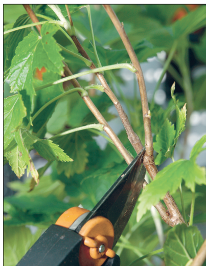
Oksad on liiga tihedalt, keskmine tuleb ära lõigata.