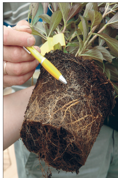
Kui juured hakkavad potis juba ringe tegema, on viimane aeg selline istik mulda panna. Liiga kaua potis olnud taime juured tuleb istutades ettevaatlikult laiali tõmmata, muidu on põõsa edasine kasv häiritud.