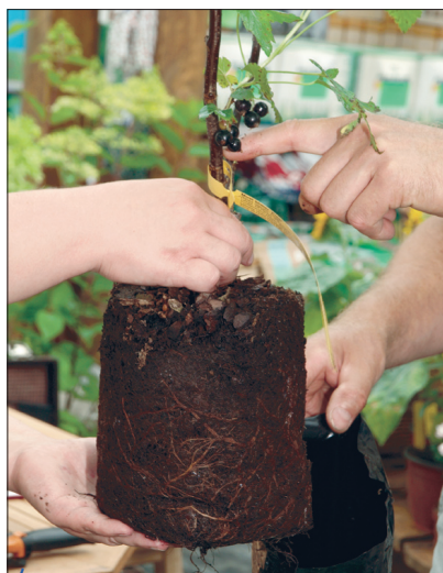
Must sõstar istutage kuni 10 cm sügavusele. Kui turvas on kilekonteineris kohev (istik pole veel korralikult juurdunud), pange kilekott istutusauku ja lõigake alles seal lahti. Kui eemaldate kile varem, pudeneb turvas juurte ümber laiali.

ni, kuni lume tulekuni. NB! Lõikamisel ärge jätke kunagi tüükaid!