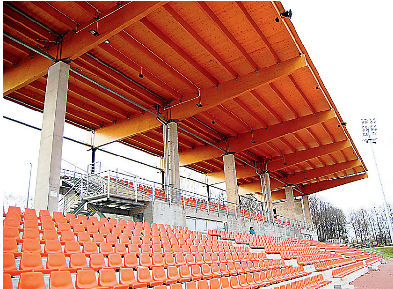
LIIMPUIDU eriauhind: Tartu Tam- me staadioni tribüün. Arhitektid: Andres Siim ja Kristel Ausing, AB Siim ja Kreis. Ehitaja: AS Nordecon. Auhinda annab välja AS Liimpuit.