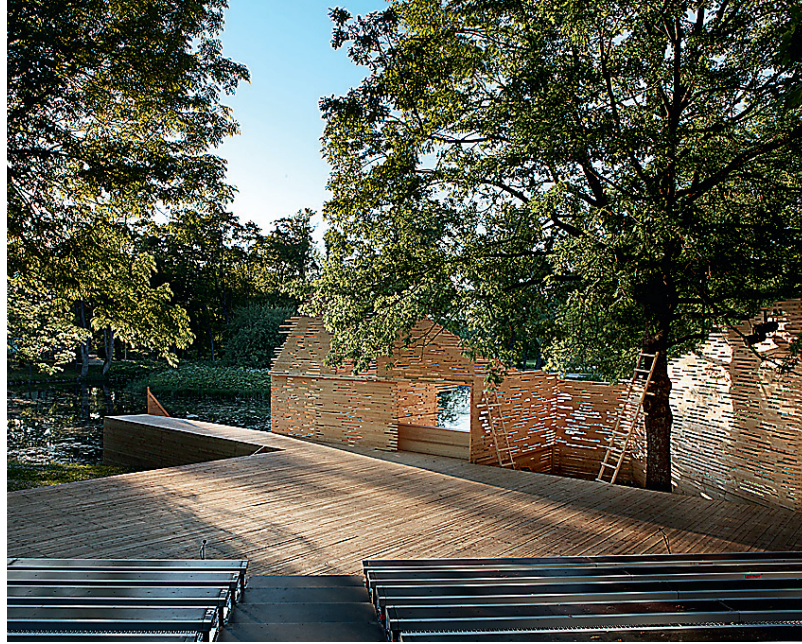
FASSAADI- PREEMIA: Rakvere Teatri ajutine suvelava. Ar- hitektid: Ott Kadarik ja Mihkel Tüür, Kadarik Tüür Arhitektid OÜ. Ehitaja: Rakvere Teatrimaja SA lavame- hed. Auhin- da annab välja AS Rait. FOTOD: OTT KADARIK