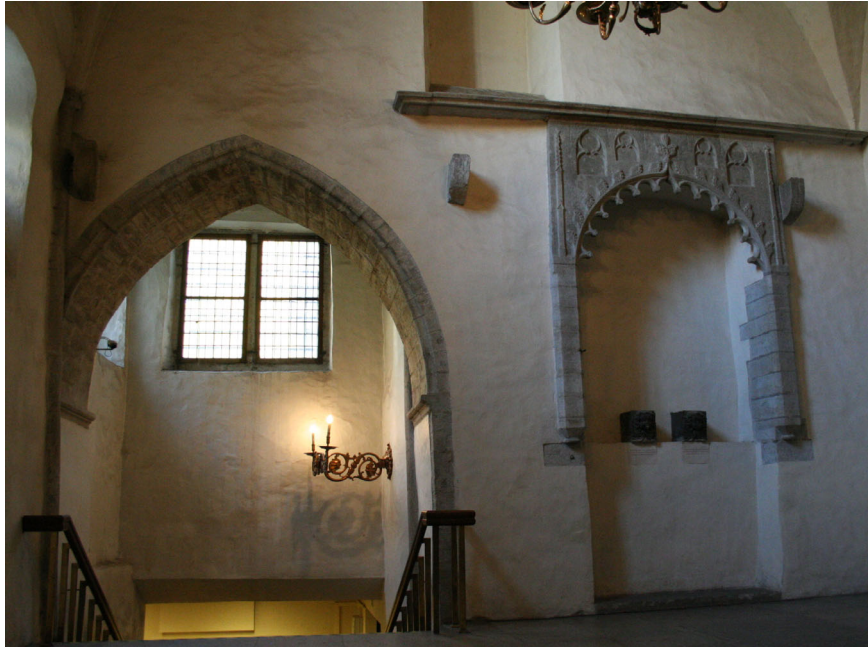
Joon 4. Eeskoja idasein oletatava luukambri ja Heise Patineri altariga.

ridele viiva trepikäigu ehitusega ja seetõttu mõjub see pealiskaudsel vaatlusel pidulikult kujundatud seinanišina. Kuid lähemalt vaadates muutub olukord sootuks. Ehisraamistusega on edasi antud eendtugedele toetuvat ümarkaarse avaga baldahhiini, mille avause ülaserava kaunistavad keskse ristlillikuni suunduvad krabid ja allserava palistab poolringikujuline roosipärg. Eendtugedest kasvavad välja astmelised fiaalid ja baldahhiini ülaosa kaunistavad neli miniatuurset ehisraamistuses teravkaarset petiknišši. See on väga imposantne kompositsioon, mille algset mõju vaatajale suurendas veelgi raidraami katnud polükroomia. Võib eeldada, et see ehisraamistus ei ole olnud pelk niši kaunistus, vaid on pigem altarit katnud. Niši serva ääristavate rooside järgi võiks altari nimipühakuks pidada Neitsi Maarjat. Et teadaolevatest Jüri kabeli altaritest saab vaid üht Jumalaemaga seostada, võib eeldada, et kabeli idaseinas asuv roosidega palistatud raidbaldahiin on katnud Heise Patineri altarit ja sellel seisnud Maarja kuju.