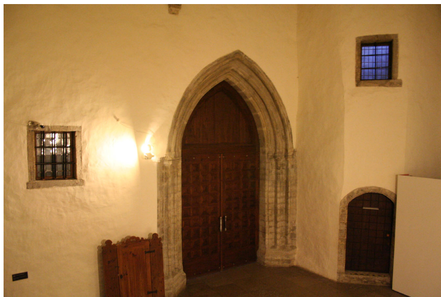
Joon 2. Torni põhjaportaal selle ees asunud kabeli konsooli ja uusaegse trepitorniga.

Ehituslikult on torni põhjaportaal trepitornist vanem, kuna viimase ehitusega on osaliselt kaetud portaali läänepoolse palendi väliskülg. Seega võib öelda, et trepitorni ehituse ja torni põhjaportaali valmimise vahele jääb mõningane ajavahe-mik. Trepitorni valgustavad suured nelinurksed raidraamistuses trellitatud aknad, mis kõik on ehitusaegsed. Kui enamik neist asub trepitorni lääneküljel, siis üks asub ka idaküljel ja Kangropooli ning Lumiste kontseptsiooni kohaselt pidanuks avanema kabelisse. Trepikäigu valgustamises teise ruumi kaudu pole keskaegset