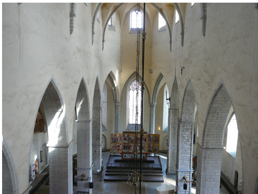
Joon 7. Vaade kooriruumi oreilirõdult.

dustades polügonaaelses vormis lõpmiku. Ruum muutus avaraks ja valgusküllaseks. Uue kooriruumi kesksed võlvikud ümbritseti paari meetri kõrguse seinaga või võrega. 134 Seal paiknes Püha Nikolause peaaltar.