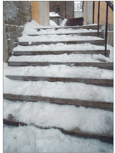
Libe trepp on suureks ohuks.

Poest saab soetada ka keemilisi jääsulatusvahendeid. Need eraldavad lume ja jääga kokku puutumisel soojust, mis ei lase erinevalt teistest abinõudest ka hiljem jääkihil uuesti tekkida, olles seega väga efektiivsed, kuid mitte väga odavad.