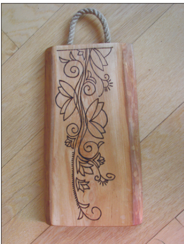
Lihvitud, õlitatud ning põletusornamendiga kaunistatud sanglepast lõikelaud.

Koolitusele tulles on mehed puutöös enamasti edasijõudnud ja nemad saavad kohe esimesel korral hakkama näiteks puulusika tegemisega. Naistele pole mingi probleem teha valmis võinuga või pannilabidas ning nad naudivad esemetele mustrite põletamist. Lapsed saavad sanglepast valmis lõikelaua. Et