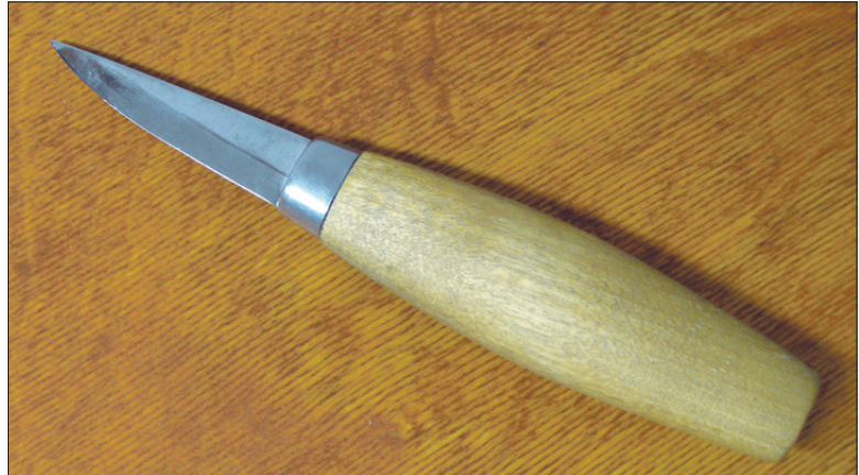
Voolimisnoal on lühike terava otsaga tera.