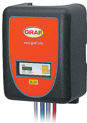
ANNUSPUHASTI töötab vaikselt ning ekraanilt saab toimuvast ülevaate. FOTOD: