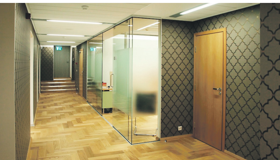
FINANTSINSPEKTSIOONI ruumides domineerib puit ja klaas.