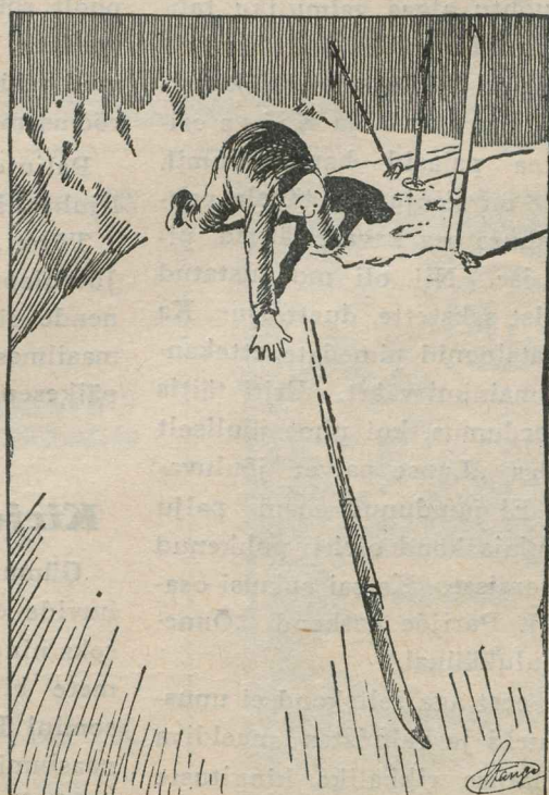
ÜKS PIINLIK „ÄRASÖIT“.

Pärast, kui kell hakkas juba 12 saama, hakkasime õnne valama. Kõik valasid. Viidrihil oli mitu tinakamak, muudkui jagas kõigile. Kõige este valas ema, temale tuli imeplik looma pea, sarvedega sedamoodi, lehma või mõne teise looma oma. Teised ütlesid, et ema hakkab tulevaasta lehma pidama, aga ema ütles, et kust see vaene inime lehma saab, et ei saa kitsegi. Siis valasin mina. Süda omal veel väri-