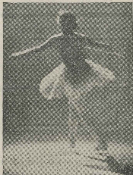
HÖLJUV TANTS ÜLE JÄÄ.

12. JAAN.: Helilooja Aleksander Lätte 75., luuletaja Joh. Barbaruse 45. ja schveitsi kasvatusteadlase Heinrich Pestalozzi 188. sünnip.