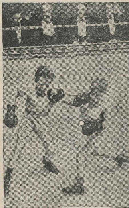
INGLISE NOORED TREENINGUL.

Aikesetormi sattuda tähendab lennukile suurt ohtu, sest et välk võib kergesti tabada lennukit. Just enne jõulupühi juhtuski raske õnnetus Hollandi hiigel-lennukiga, mida nimetati „Lendavaks Hotelliks“. Ta leiti põlenult Süüria kõrves ja arvatakse, et välk süütas ta põlema. Lennukil said surma 3 reisijat ja 4 meeskonna liiget.