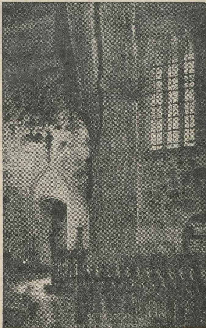
UUE AASTA SAABUMISEL.