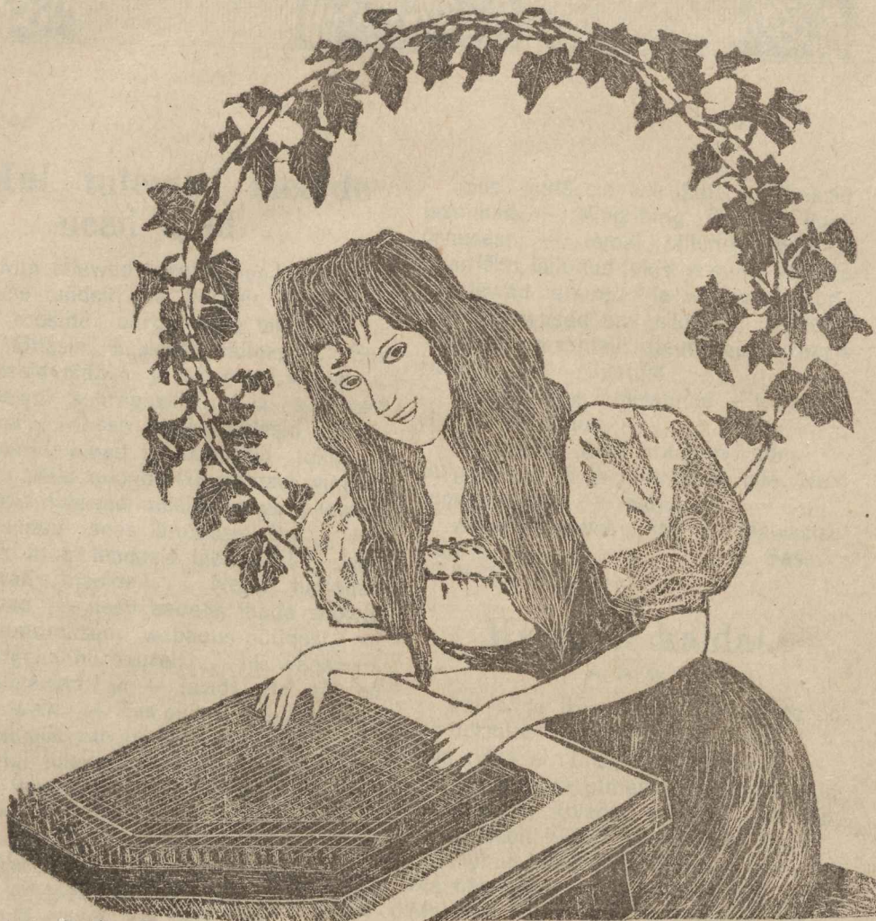
A. Suurkask'i puulõige