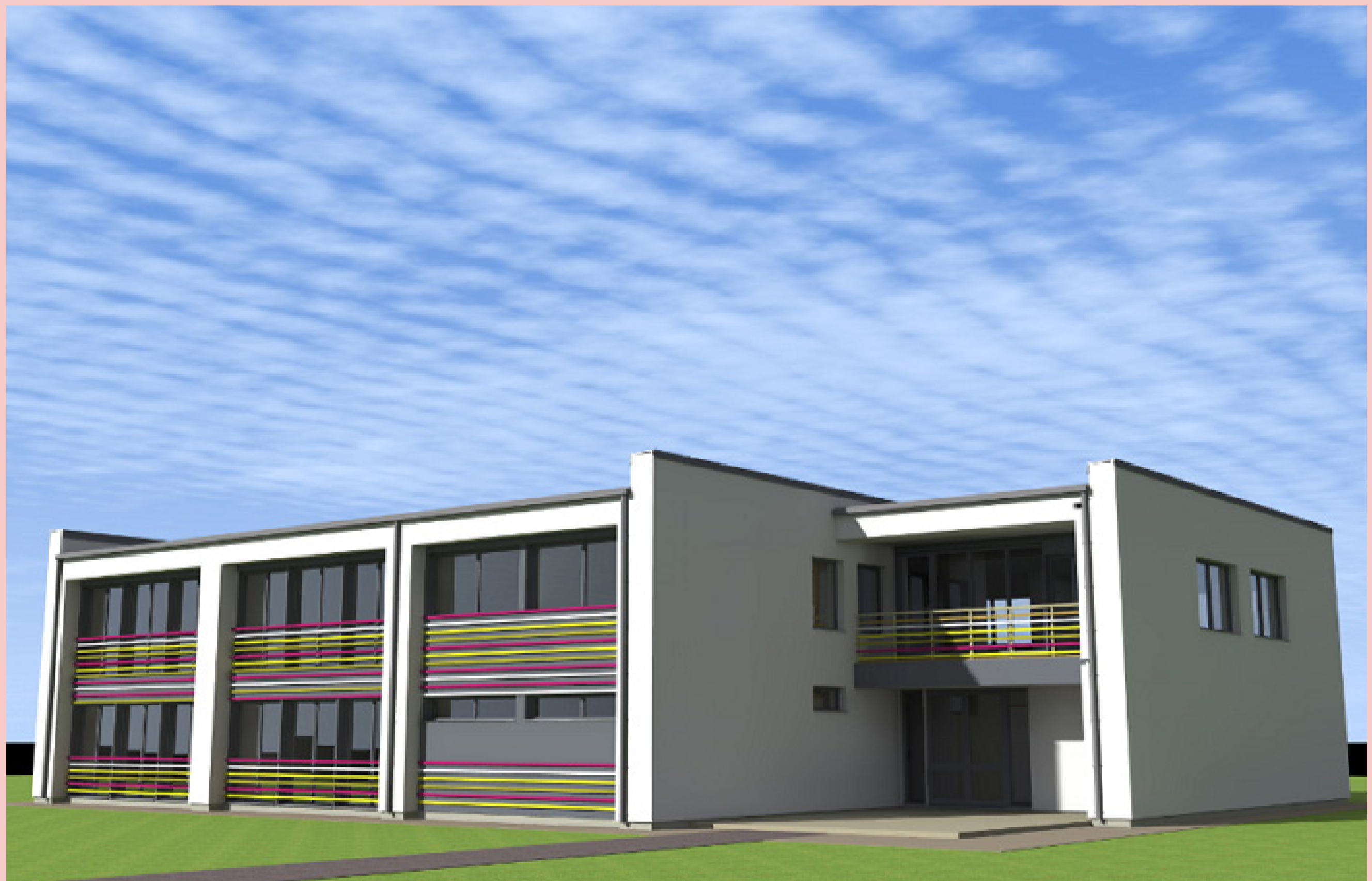
Tulevane Remniku maja