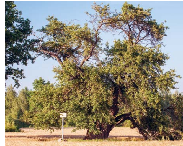
Oti metsõunapuu Viljandimaal.

Analoogne nõue on HPK nõudena kehtinud alates 2010. aastast, täpsustatud on konkreetsed looduse üksikobjektid, mis võivad põllumajandusmaal esineda.