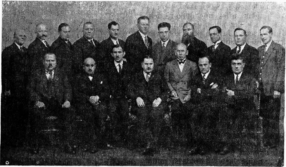
Balti riikide transporttöölise konverentsist osavõtjad.

Et see konverents alles esimene oli, siis omas ta peamiselt vastastikkuse informatsiooni ilme. Peale harilikke avami-