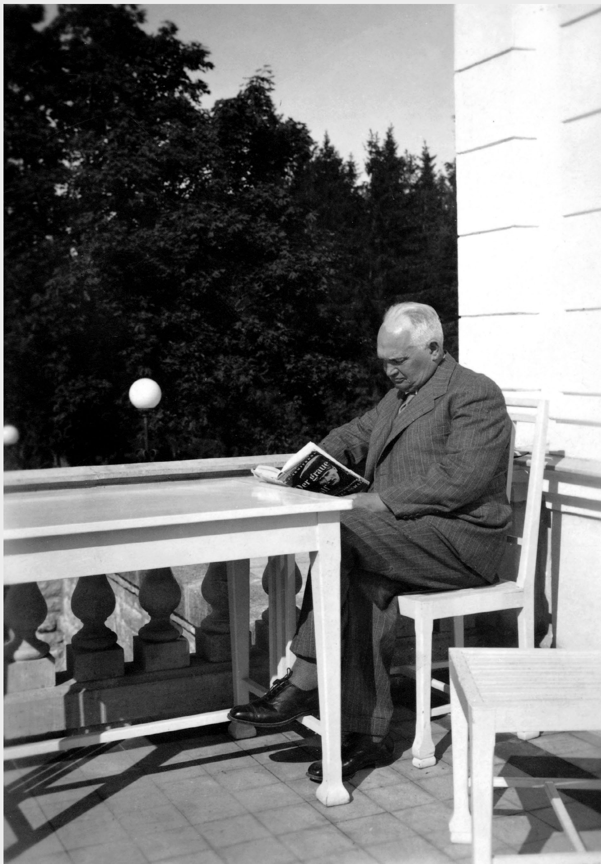
Konstantin Päts Oru lossis.