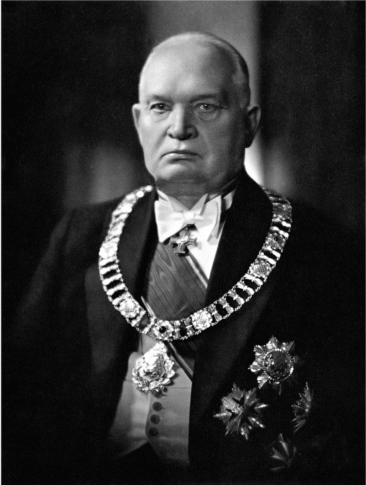
President Konstantin Päts 23.02.1874–18.01.1956