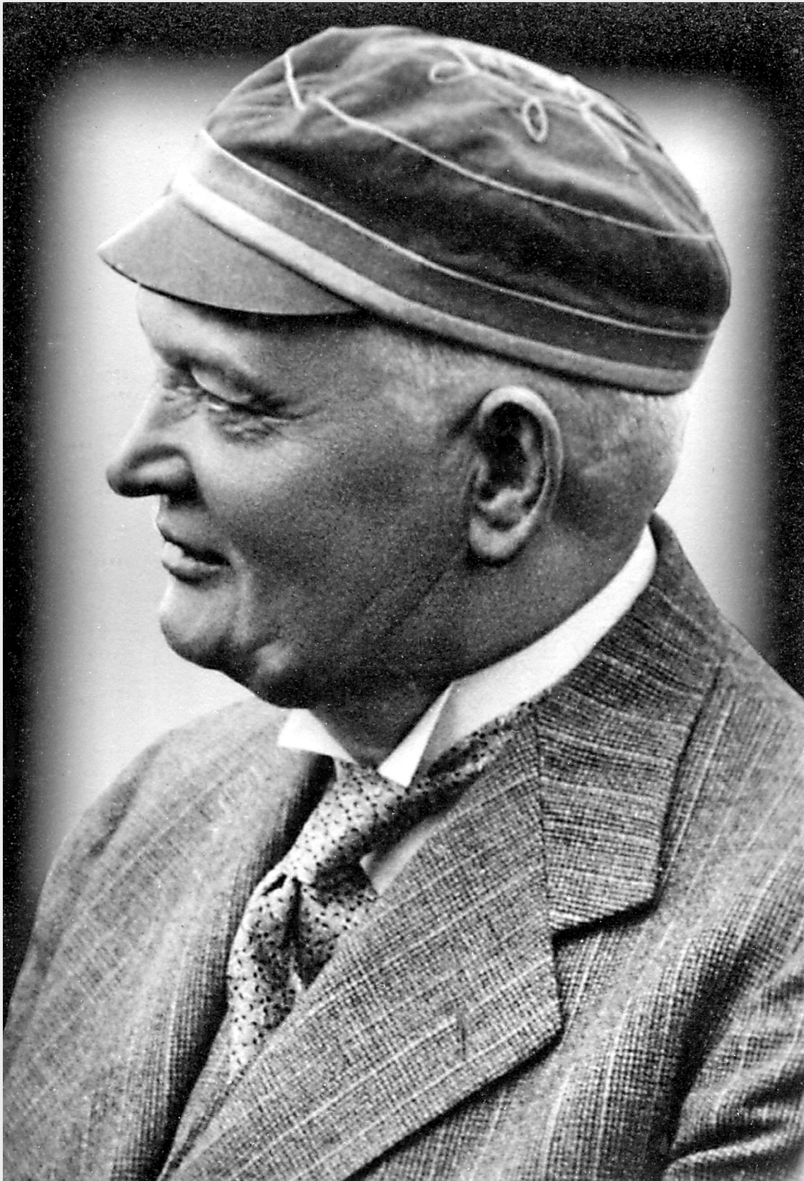
Konstantin Päts korp! Fraternitas Estica auvilistlane 22.04.1938