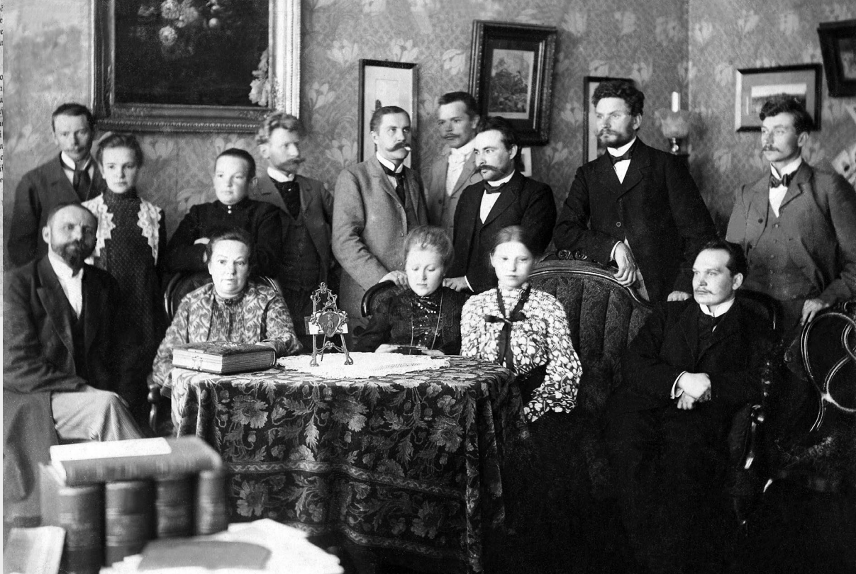
Teataja toimetis 1903. aastal Mihkel Martna kodus. Diivanil paremal istub Konstantin Päts (vastutav toimetaja ja väljaandja).

Roosakivi profekt. Mis armastate järele annab aiatu, mis juure võotla poole mis pöördust talub, see misjagu ümälöödet ta neil tantsu olemas, lüde elu igapäevase mõista, rahvaste-tantsu tantsu tantsu olemas, mis on juba kindlad elu olemas. Mis armastate järele annab aiatu, mis juure võotla poole mis pöördust talub, see misjagu ümälöödet ta neil tantsu olemas, lüde elu igapäevase mõista, rahvaste-tantsu tantsu tantsu olemas, mis on juba kindlad elu olemas.