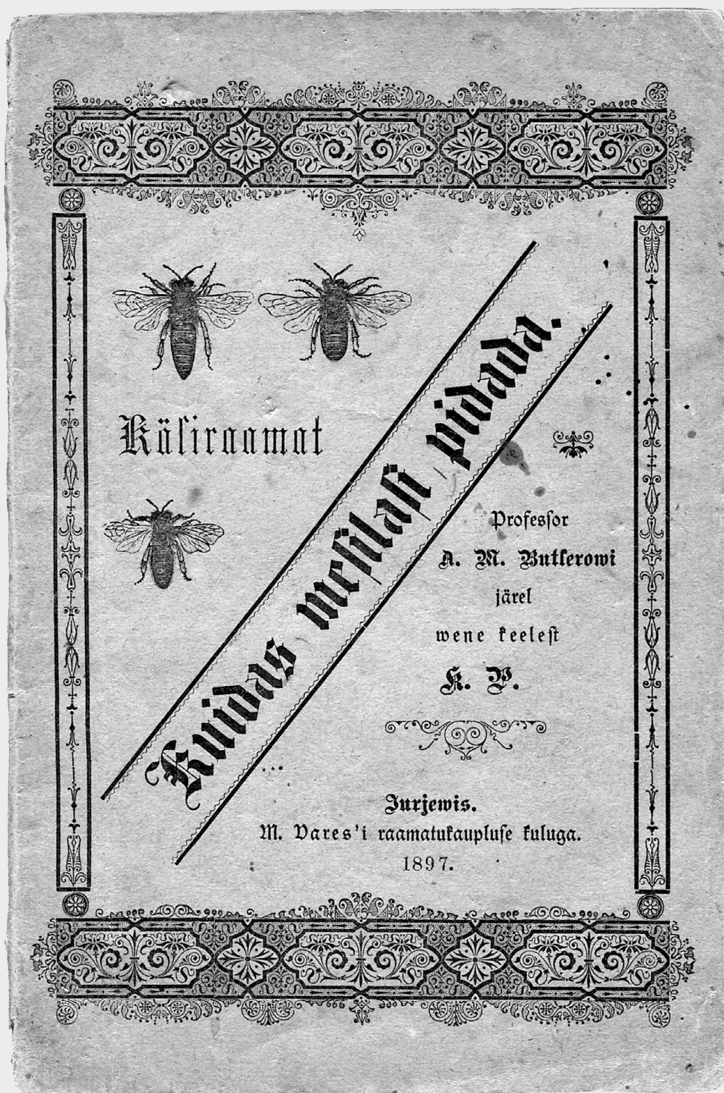
Käsiraamat "Kuidas mesilasi pidada." Jurjev, 1897. Konstantin Pätsi esimene tõlkeraamat üliõpilaspõlvest.