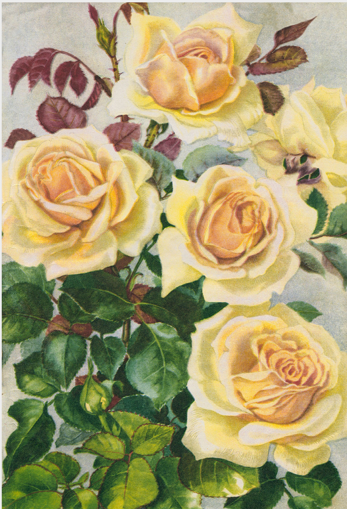
President Konstantin Pätsi nimeline roos. Illustratsioon ajakirjast L.Späth, nr. 313. 1937.–1938. aastakäik.