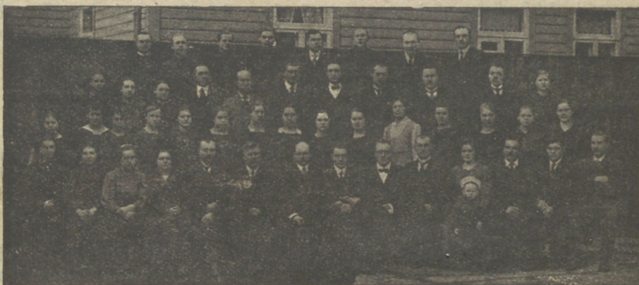
Allika Baptisti koguduse C. E. ühing.

ärkamist, täielikku äraandmist Isandale, uuestisündimist ja Jumala lapses saamist, nagu see sündis esimese seltsi liikmetega seal Portlandis. Seks uuestisündimiseks ei tule koguni mitte pidada mõnda dogmalist seadust ehk talitust, mida mõni õpetus kinnitab, waid terve elu peab olema uueks saanud. Hingelik pööre peab olema sündinud inimese elus, mis waldub kõige enne neis wälimistes tundemärkides et: C. E. seltsi liige ei wõi enam minna teatri, kinosse, tantsumajadesse, ega mujale ilmaliku lõbu kohtesse, kus ta käis enne usklikuks saamist, „sest see on temale patuks saanud.