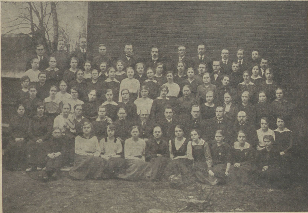
Tallinna Sini-Nõu C. E. noored 1920 aastal.

nemad nõnda elada ja ise seal juures rahulikud ja rõõmsad olla — paluda, tänada ja laulda, kuna minule Kolgatal need asjad halvaks ja hirmsaks läksid ja ma tõutasin neid jäädavalt enesest ära! Aga — mõtled ennast rahustavalt, nad on ju ometi Jumala lapsed, võib olla, koguduse ja nooruse ühingu liikmed. Nad ei või siis mitte hukka minna.“ Nõnda mõeldes tõusid sinu hinges laened ikka tormiliseks. Sa ei suutnud arusaada, et sinu