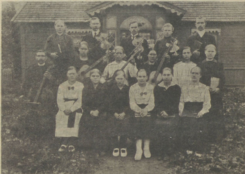
Aruküla C. E. noored 1920 aastal.

Mis ja teed seda tee usinaste. Ta oli otsus- tand ja lahkus, kadudes wõlwituse wäljakäiku. Rajasid weel tumenewad sammud.