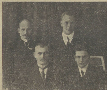
Soome C. E. reisisekretärid minewa aastase Eestis oleku puhul.

ja haigemajades peeti koosolekuid; kuulutati julgesti Kristust, laulu- ja muusikatoori kaastegevusel. Sisemine korraldus ja töö kombes ses asutuses tuletasid meelde üleilmliisi noorte usklikude C. E. liikumist, olgugi, et põhikiri puudus.