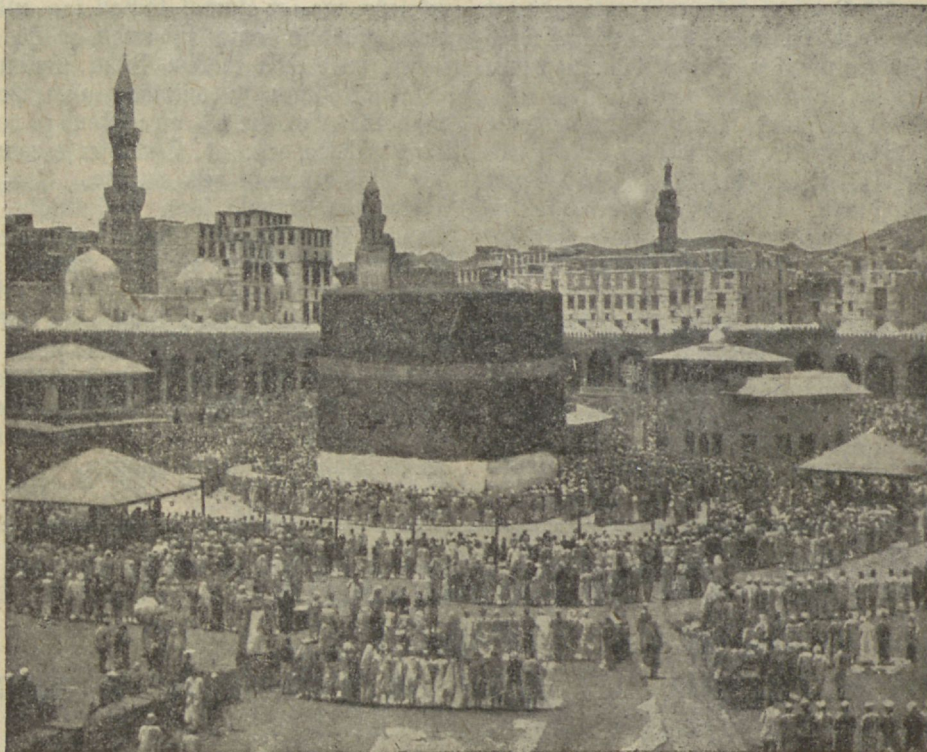
Must kiwi Mekkas ja usurändajad selle ümber.

Poliitiliselt on suurem osa muhamedi usulisi Inglise ülemwalitsuse all, järgmine osa Prantsuse, siis Wenemaa ja lõpuks Daanimaa walitsuse all. Üldiselt on 161.060.870 mosle-