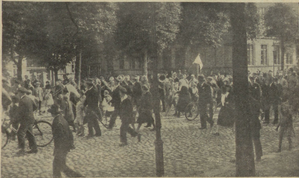
Rongikäik teekonnal Johannese kirikusse.

B. Abbot ise jutustab: „Homnikul oli hetk, mil kõik ligiolemad sulasid Isjanda ees ja paljud nutsid. Shtupoolel walas Isjand meile oma Waimu seesuguse wäega, et paljud langesid Isjanda wäe all, teised lamasid kui surmawaludes, kisendades Jumala armu. Paljud said rahu. Au olgu Jumalale selle eest, mida mu filmad said näha sel päewal, kõrwad kuulda ja hing tunda õnnistatud waimust!“ Teisest samasugusest koosolekust ta jutustab, et