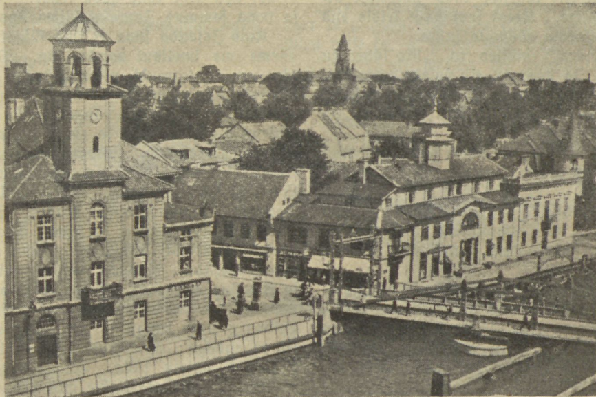
Waade Meemeli linnast.

Tõepoolest oli see töö Jumalast. Paljud, kes olid põlanud kõik inimlikud ja jumalikud seadused,