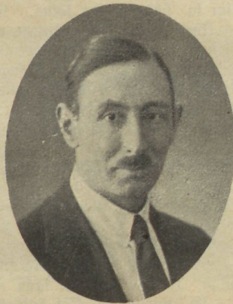
P. Achenbach. Wiibis hiljuti Cestit.

Milijed raskused arenewad sest wälja perekondlikul ja kõlblisel alal?