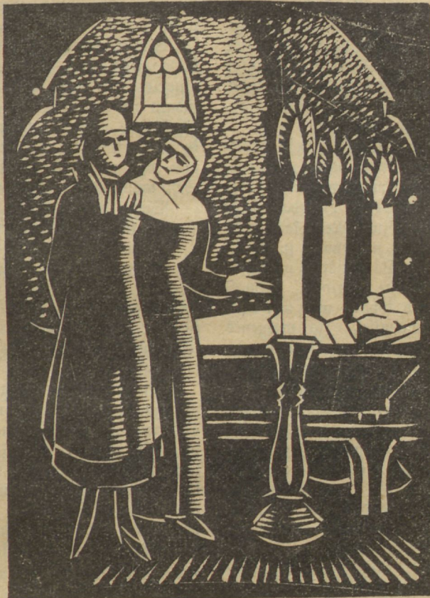
Seest seal lamas ta pihtiisa, kõrgel asetatud ja küünlaisi piiratud lahtises kiristus — ta oli surunud.