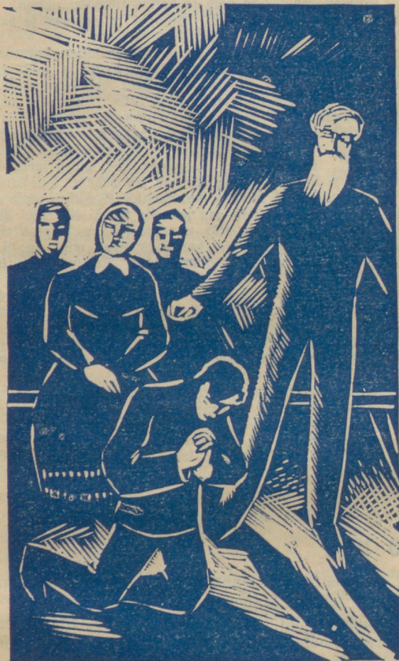
Direktor tõusis wihajelt ja wäljus . . .

„Ei wääri ma, et istun teiste reas.“ Palusin teda siiski jälle istet wõtta. Direktor kuulis kõik ja istus väga rahutult omal pingil. Wiimaks tõusis ta wihajelt, lõi jalaga wastu maad ja ütles: