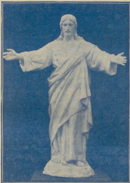
Jeesus awali käsi. Matt. 11 : 28.