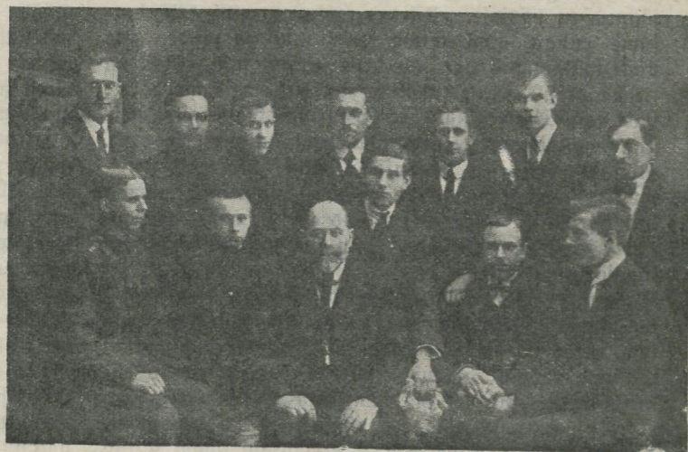
Noormeestetoimkond 1921. aastal