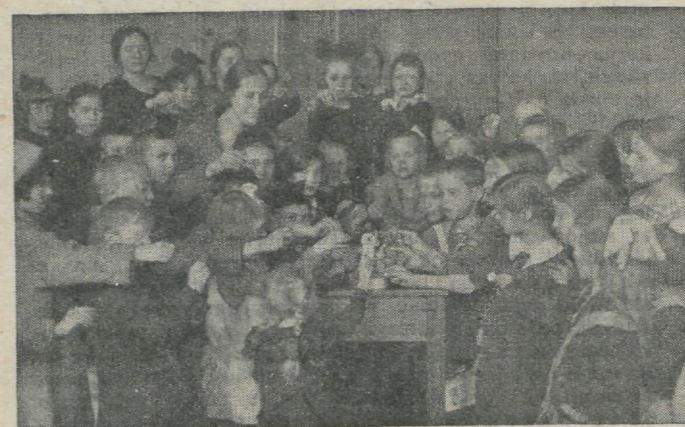
Pühapäevakooli lapsed välismisjonile omi andeid ohverdama, mida „neegripoiss“ lahke kummardusega vastu võtab