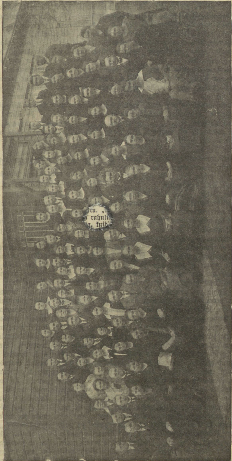
Tall. „S. R.“ Seltsi „C. E.“ U.-Noorte Ühingu 1926. aastal. Mitmed liikmed puuduvad pildil.

Naerulaginal pilkasid teised teda — kuis võib ta nii lapsik olla, et unenägu tõena võtta ja veel