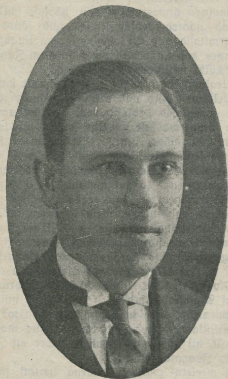
A. Pitkjaan Praegune ühingu esimees!