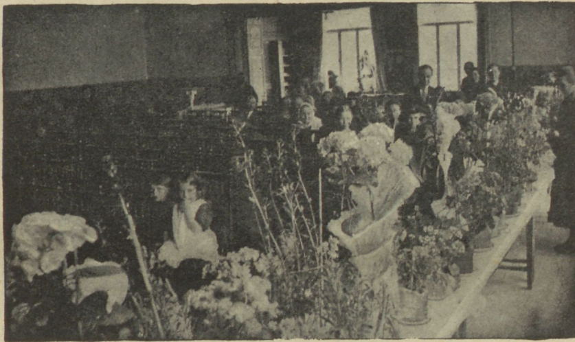
T. S. R. „C. E.“ Ühingu päikesepaiste toimkonna lillelaud 1926. a. lillepäeval.

Ehk loeb seda inimene, kes ei leia veel enefes pattu, — kuid fiiski on inimeses hea- ja kurjatundmine. Wõib-olla on sinul juba mõni idee, ehk mõtled midagi teha inimsoo kasuks, mõtled ise täiusele jõuda; eriti elawalt kerkib üles see waikseil tundidel, olles eemal ümbruskonna askeldustift. Neil minuteil täidab su südant ootamata kurbus ja tunned kahju millestki, mis puudub, mis nagu on kadunud. Sa nagu tahaksid nutta, ja wahel tõesti walad pisaraid. Sa ei teagi põhjust, kuid sa nutad hinges tumenenud täiuse, kaotatud puhtuse, oma hinge pärast, mis igawene Looja asetas muldsesje ihhu ja mis on kurwastatud ja väga alandatud su halwa elu tõttu. Sa nutad kuninganna pärast, kellelt on kistud puhtuse ja pühaduse kallid rõtwad, ja kellele on selga pandud kerjus-hilbud, mis on teotatud ja rüwetatud. Sa nutad enese pärast, oma feestpidise inimese pärast, kes oli