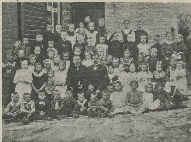
Pühapäevakool 1911. aastal, millest võrsunud ühing