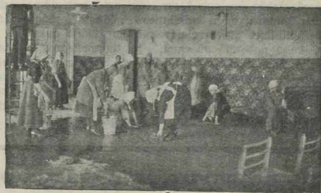
Noorea Ühingu ruume puhast mas aastapäeva puhuks 1927