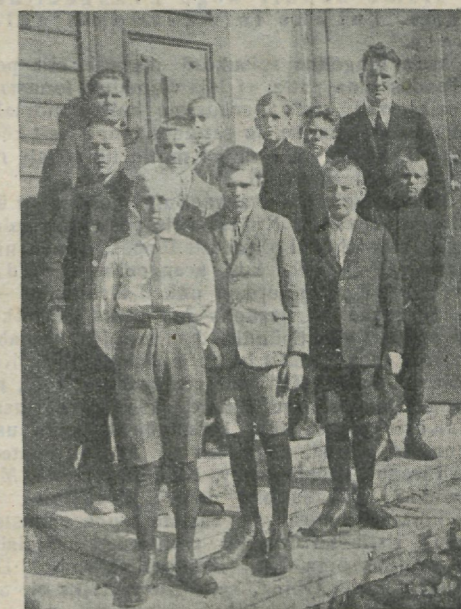
Juunioride poiste grupp