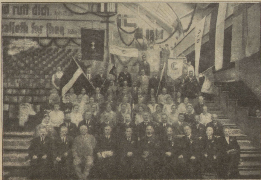
Hajariikide esindajad Berliini konwerentzil.

Terwituste õhtul. Wõifime filmaga näha esitatud nooruseltfe. See oli koosolekus hetk, mis