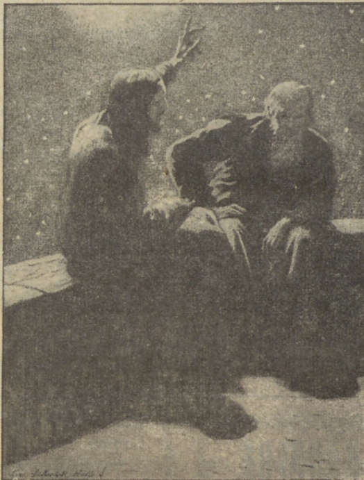
Jeesus ja Nikodemus.

Oled sa näinud Kalilea järvel paadikesi tormidega heitlevat, kui tuuled tõusid ja lained kerkisid kui mäed ning kostusid hädahüüded tormi määratlevas mühinas, kuid rannal löödi hädakella oigavalt? Oled sa näinud Liibanonil tormist murtud puid kui langenuid sõjamehi Jee-riku lagedal? Aga kas oled sa iialgi mõistnud, kust need tuuled tulevad ja kuhu nad lähevad? — Oi, Nikodemus, nõnda ka igaüks, kes uuesti sündinud! Mõistad sa, et see on salapärane