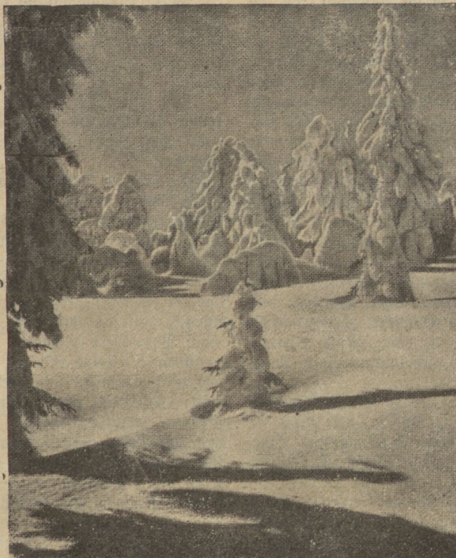
Talwe kaunidus looduses.

Kõige esite räägib ta, et on Heebrea mees ja järjekult kuulub ka sesse rahwusesse, milline oma jumalateenistuse iseäralise jõu ja oma usu läbi Jumalasse oli omandanud laialise kuulsuse. Ta rääkis, et tema Jumalat nimetatakse Jehoowa (tähendab — igawene ja nägematu). Tema on kõigewägewam taewa ja maa Looja, kõikide jumaluste Jumal, ainuke Jumal.