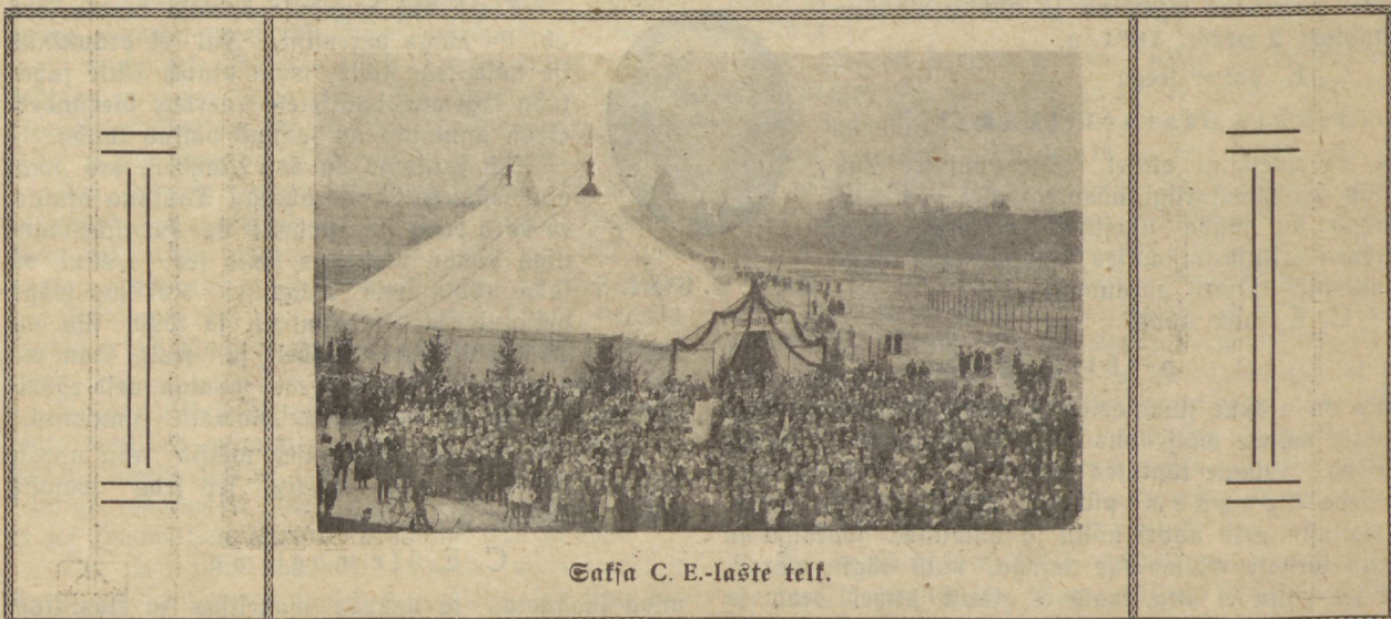
Saksa C. E.-laste telk.

Awalikud konverentsikoosolekud, mis laulu-, mängu- ja pajunakoorti kaastegemusel wäga soojad olid, pakkusid oma kõnedega palju