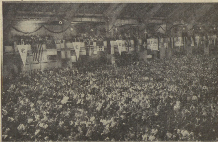
Õsa konverentfi hiiglasaalist,

Liigutawam filmapilk oli wiimane käepigistus,