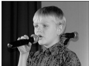
Elvas lauldi loodusest. Lk 2