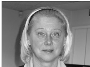
Kirjanik Proletariaadi puisteelt. Lk 3