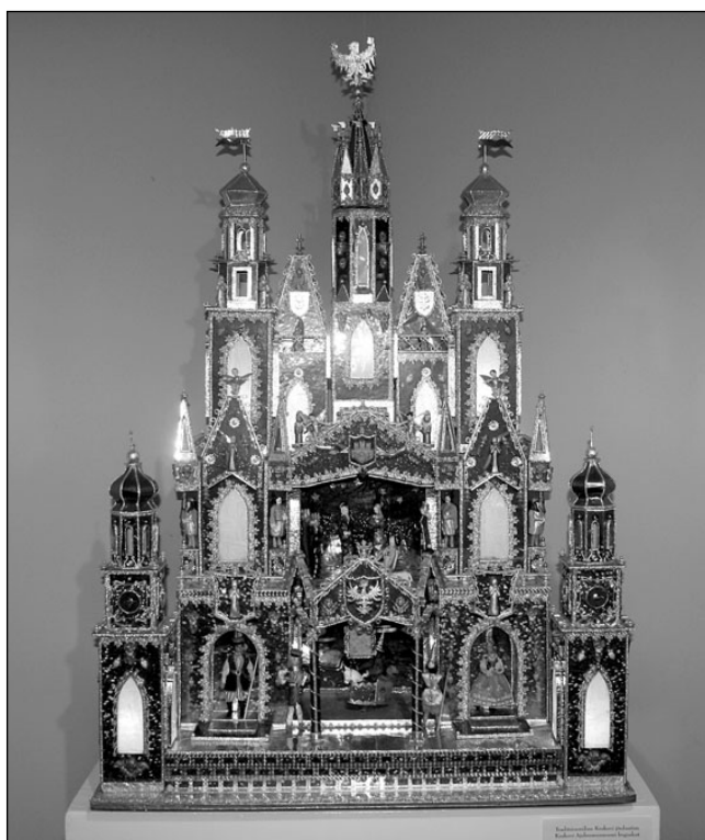
Näituse jõulusõimeid pilkupüüdvaim eksponaat, särav ja värvikas Krakowi jõulusõime, on valmistatud Poola pealinnas ja on Krakowi Püha Maarja kiriku basiilika kujuga. Krakowi jõulusõime esitleb Tallinna Poola Vabariigi Suursaatkond.

"Oleme harjunud, et jõulukuusel süütame küünlad jõuluõhtul, kuid jõulusõime paigutamine algab esimesel