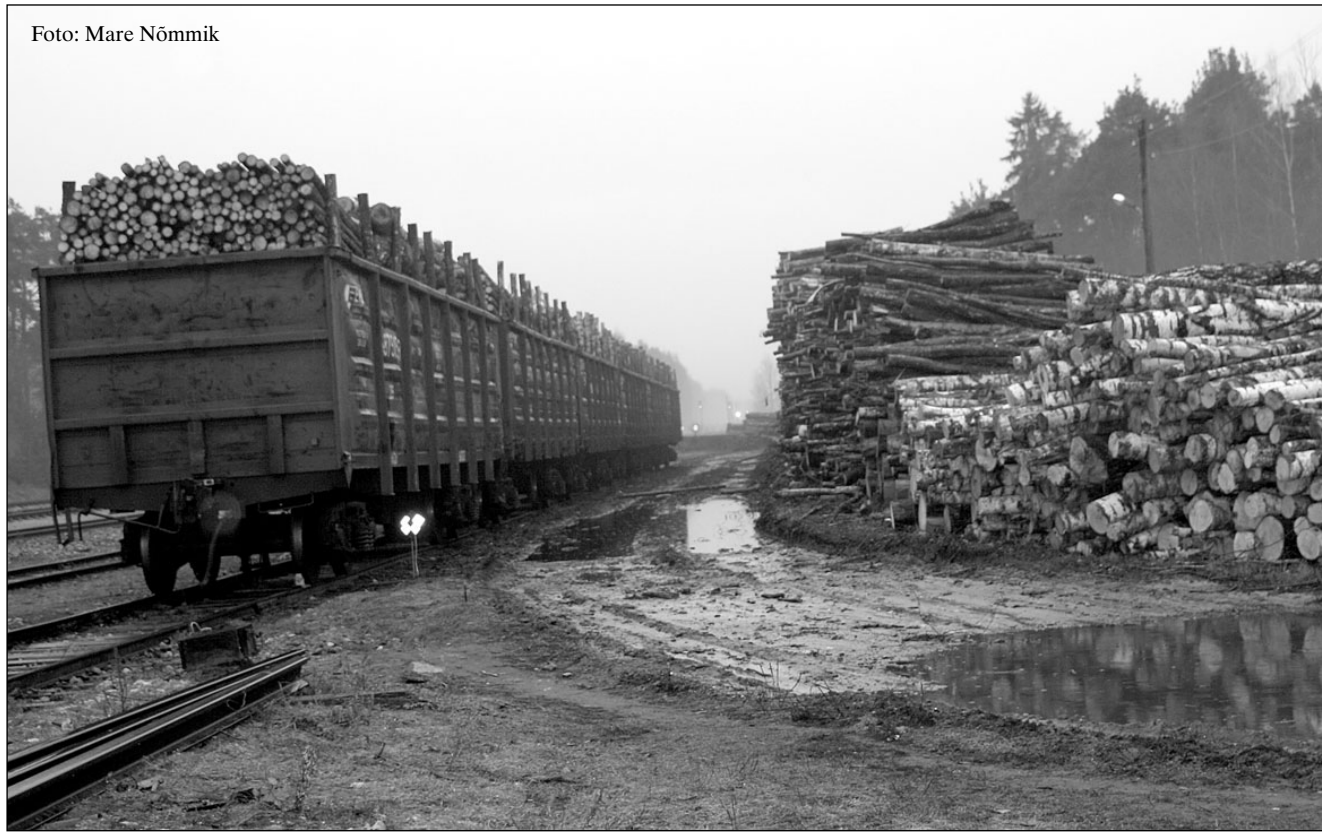
Rasked metsaveokid muudavad laoplatsti ümbruse vihmaperioodidel tõeliseks porimülkaks.