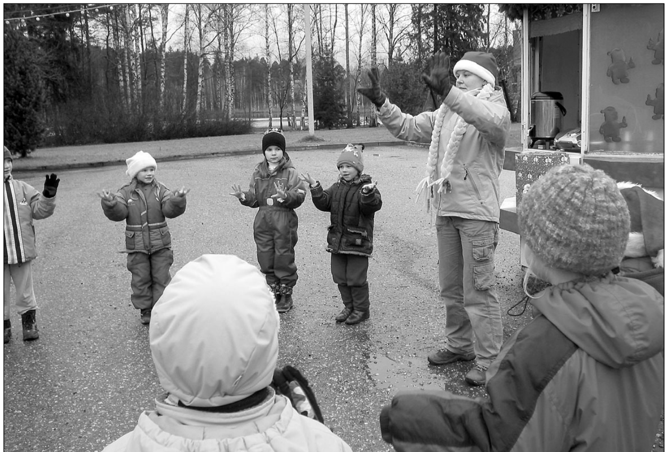
Lastel on koos päkapikk Heliisega lõbus mängida ja tantsida.

www.kiirlaen24.ee tel. 5345 6498, 730 2155