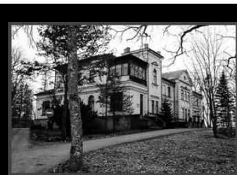
Tantsuks laulab Toivo Nikopensus Pääse 40 krooni

Pikk 8 Elvas Detsembrikuul pensionäridele passipildid soodushinnaga. E, T, N, R 10-17 K 14-17 ja L 10-15