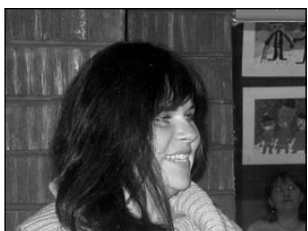
Kunstikuu läks korda. Lk 5