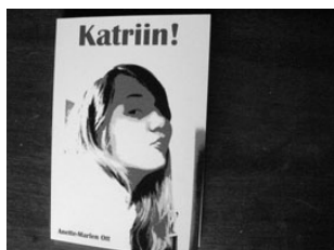
Elva koolitüdruk kirjutas raamatu. Lk 2