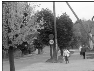
Elva kesktänav saab kaas-aegse tänavavalgustuse. Lk 2