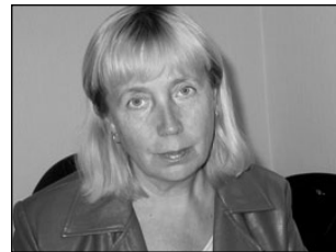
Kaks tundi tasuta tööd lunastab ühe vanglapäeva. Lk 3