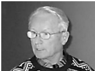
Korralduse komisjoni esimees osutus ise kriminaaliks. Lk 2