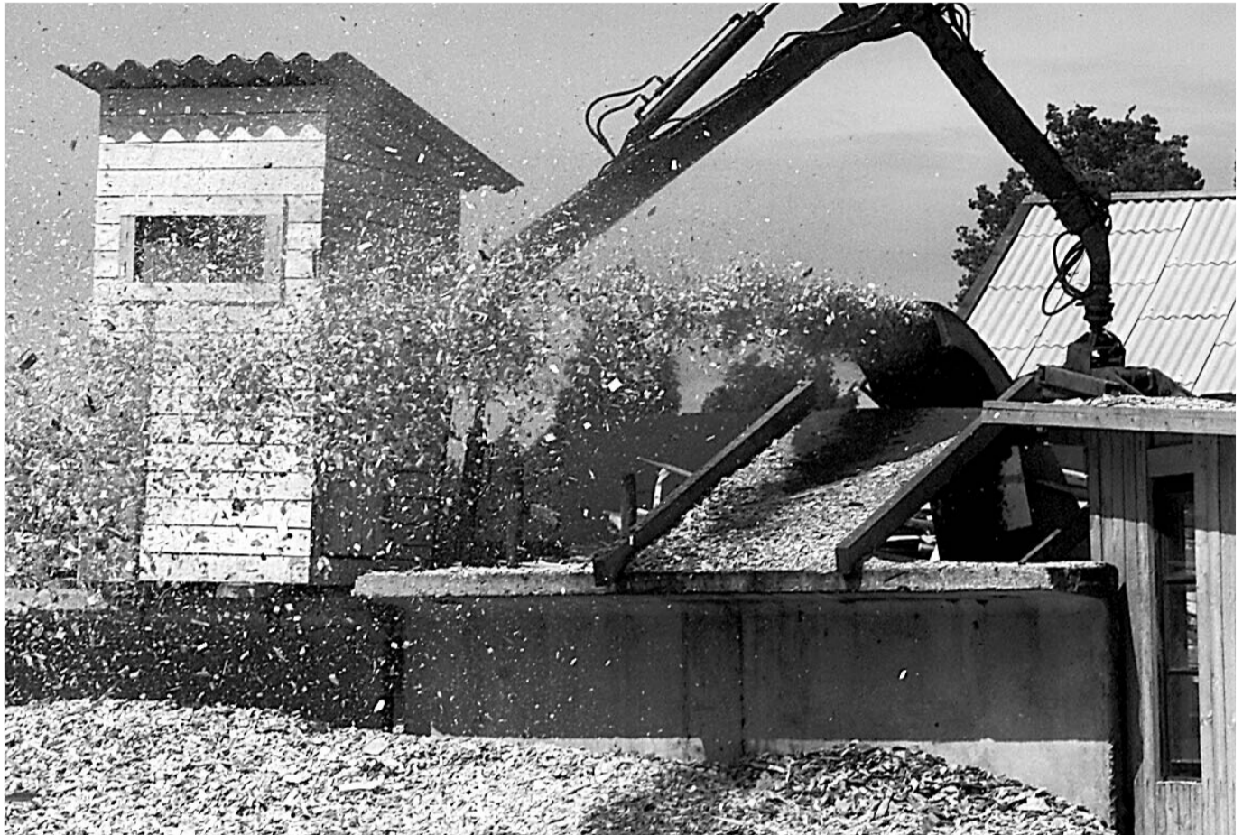
SOBIV VARIANT: hakkepuut on üks parimaid võimalusi Setomaal taastuenergia kasutuselevõtuks.

Nii pidas Kikas foorumil ettekande Västselinna valla energiabilansist, mille eesmärgiks on kindlaks teha milliseid energialiike toodetakse kohapeal ja kui palju energiat ostetakse sisse. «Eesmärgiks on minna võimalikult palju mittetaastuvalt taastuenergiaks ning sisseostetavalt kohalikele,» sõnas Kikas. Tema teada on sellise energiabilansi loomine ühe valla piires pretsedent,