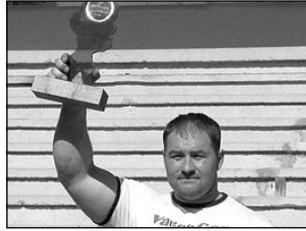
Lõuna-Eesti vägilase tiitel jäi seegi kord Elvasse. Lk 3