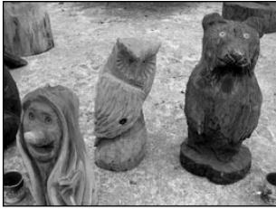
Puuskulptuure hakkab varsti kohtama mitmel pool Elva linnas. Lk 2