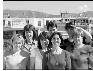
Elva õpetajad käisid Palermos. Lk 5