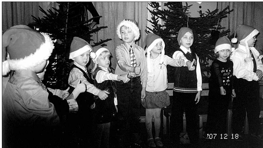
● Lapsed esinesid üheskoos...

Laulud, tantsud ja luuletused olid päkapikkude tegemistest jõuluelsel ajal. Ja saabus oodatuid – jõulumees. Tuli rõõmsalt ja naljadega. Ta ütles, et teda taheti praegust tehnikaajastut arvestades kohale saata e-mailiga, aga viimaks sai ta ise liiklusvahendi valida. Iga laps