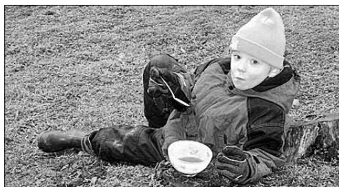
● Sõdurisupp Viiratsi lasteaias.