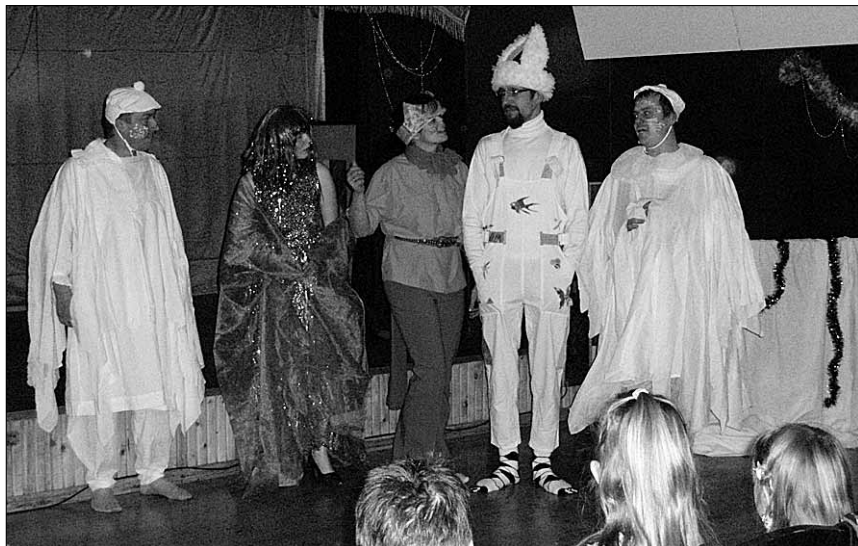
● „Pupu-Jukud” mängisid „Lumekuningannat”.

korraldiku teatri. Nende hulgest valiti ise-loomu arvestades välja näitlejad. Mingisugust peaproovi polnud, kohe tuli esineda. Reeglid said kiiresti selgeks, sest kes eksis, sellele määrati kohapeal trahv ja ta pidi oma osa õigesti tegema.