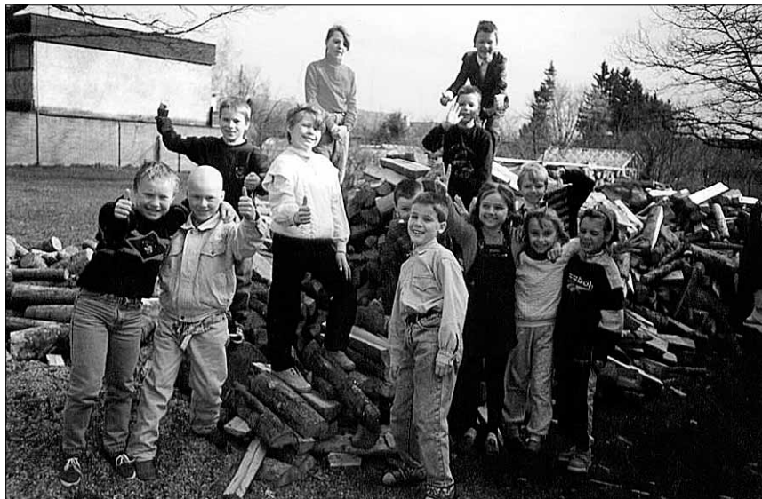
• Koolis on puutalgud.

Alles nüüd on mõnigi kolleeg tunnistanud, kuidas käis pangaautomaatide juures vargsi katsetamas, kui kedagi