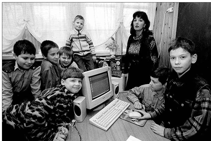
● Esimene arvuti pakkus suurt vaimustust.