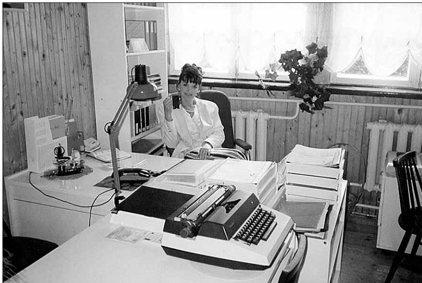
● Esialgu oli tähtsaim tehniline vahend kirjutusmasin.

läheduses polnud. Ja kõik need ja ülejäänud paroolid, mida tekkis nagu seeni pärast vihma, läksid ju algul segamini.