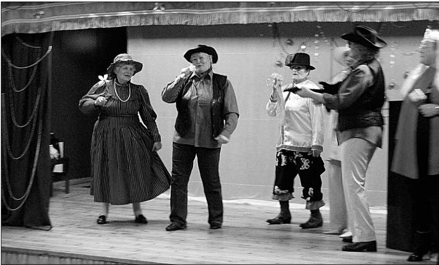
● Esinevad külalised Karksi külamajast.