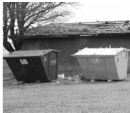
Liigiti kogumise konteinerid Käravetel