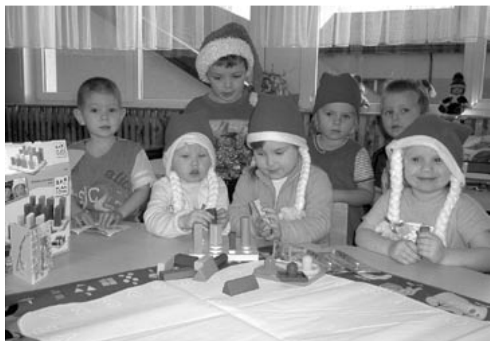
Noorema rühma lapsevanemad kinkisid rühmale last arendavaid mänguasju, mida lapsed uudistavad.