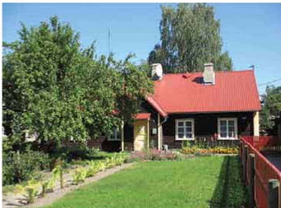
Kauneim muinsuskaitsealal jääv kinnistu on Keskväljak 6