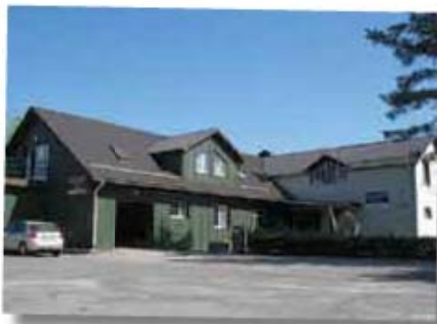
Ilusalma kinnistuga asutuseks osutus AS Paide EG