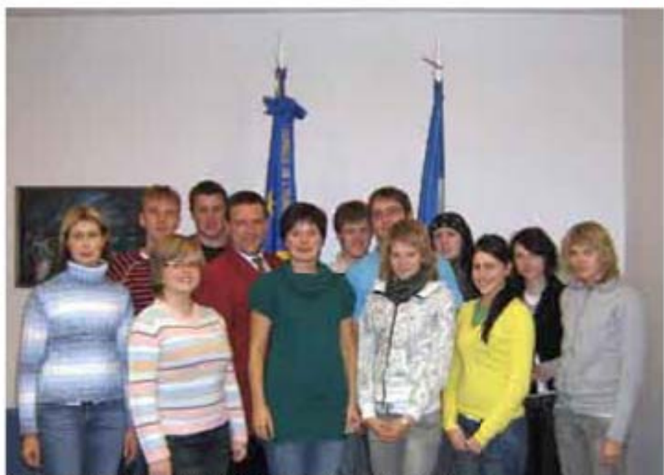
Paide noored said sõpruslinnast Saldusest palju häid ja huvitavaid ideid.