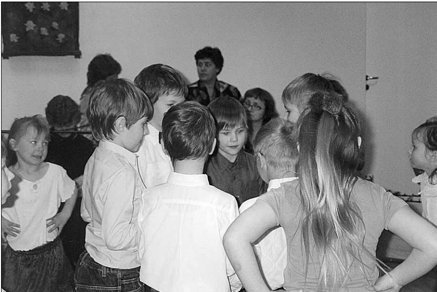
● Lasteaia tänased peremehed peavad nõu.