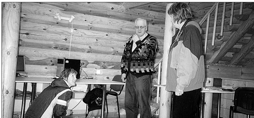
● Mööbel tuleb paika panna.