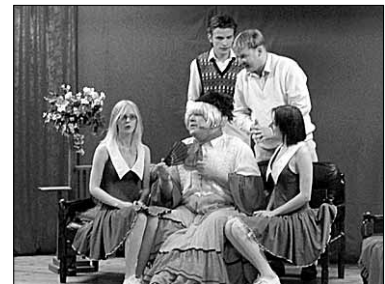
● Rannu Küläteater tõi Tänassilma „Charley-tädi“.