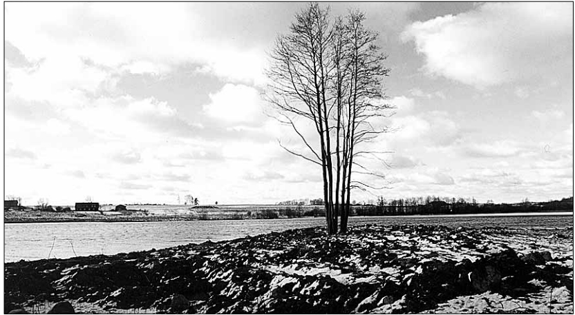
• 21. aprillil oli maa taas lumevalge.