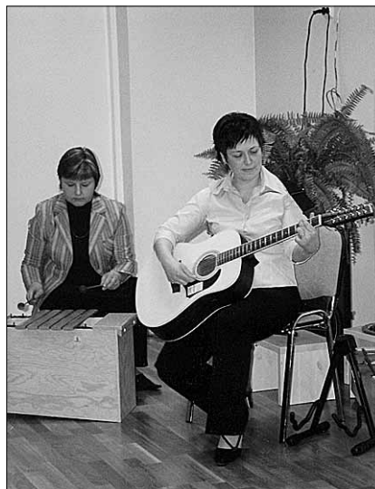
● Pillide taga on pedagoogid ise.

Täna kõiki, kes lasteaia avapeost osa võtsid ning lasteaiale palju ilusaid kingitusi ja häid soovideid.