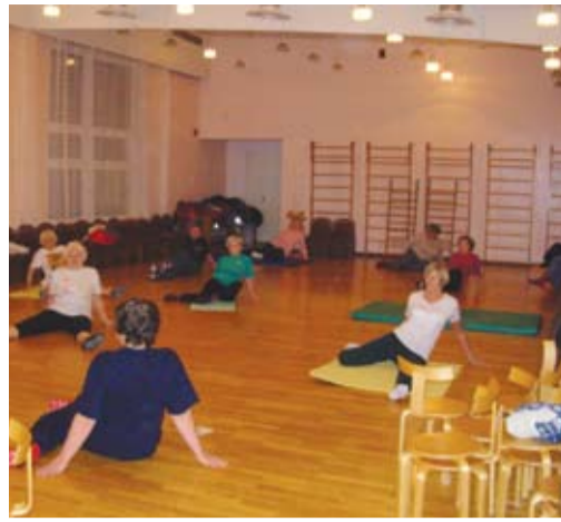
Head füüsilist vormi ja tervist hindavad võimlemisringi liikmed saavad kokku igal reedel Tibutare Lasteaias.