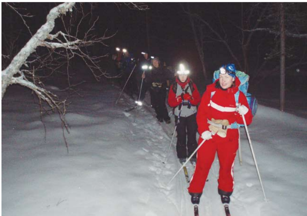
Suusamatk polaarjoone järgi kõikidele osalejatele unustamatu elamuse.

Kutsume Teid osalema uue aasta sissejuhataval pidustusel laupäeval,