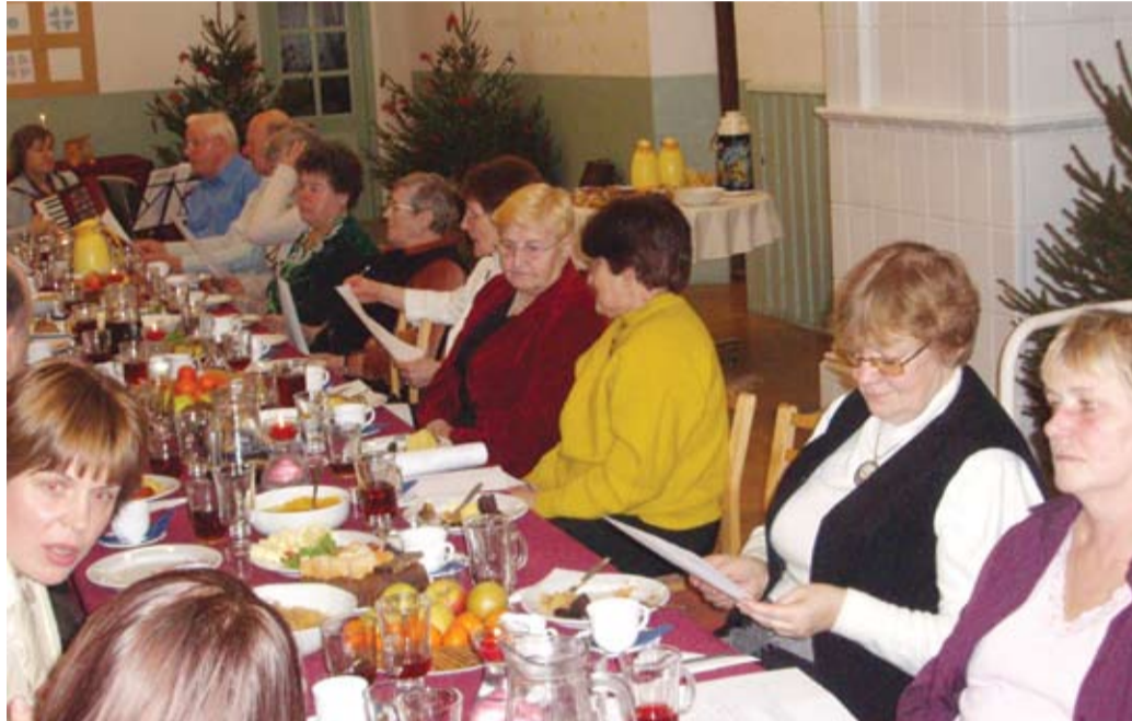
Laululehed jagatud – kohe algab ühislaulmine.