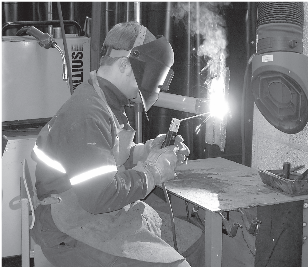
Hetk keevitajate koolituselt.

Moodulid ehk teemad on erineva mahuga, reeglina alates 40 tunnist. Soovi korral võib õppija komplekteerida endale mitmest moodulist sobiva indivi-