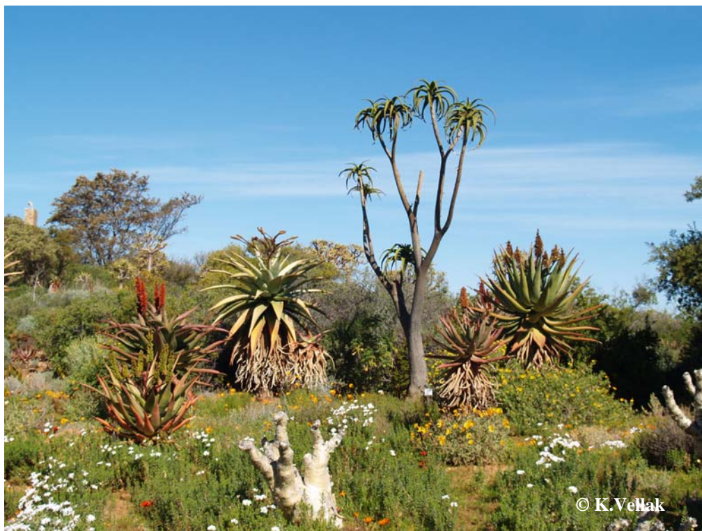
Foto 2. Erinevad aaloeliigid Worcesteri Karoo botaanikaaias. Different Aloe species in the Karoo Botanical Garden in Worcester.

Lisaks ettekannetele said kõik osavõtjad võimaluse maitsta Lõuna-Aafrika veine ja külastada Worcesteris Karoo botaanikaeda, mis oli üsna rikkalik ja huvitav (Foto 2). Mainiksin ka näiteks seal kasvavat velvitšiat ( Welwitschia mirabilis ), mida mitmed, sh mina enne näinud polnud. Karoo on Lõuna-Aafrikale iseloomulik poolkõrbeline kooslus, kus domineerivad sukulendid.