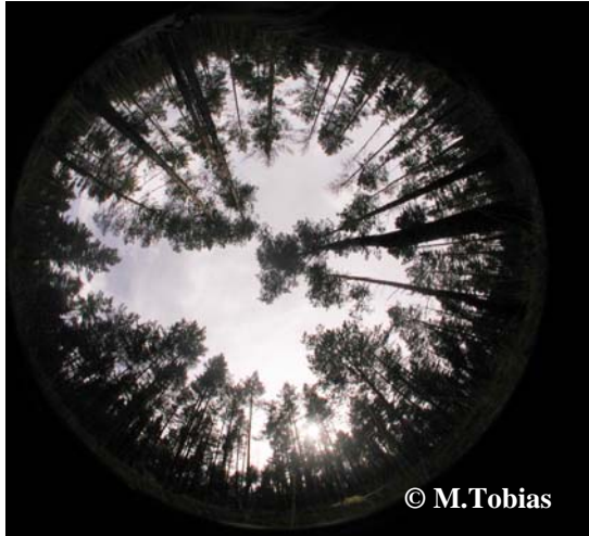
Foto 1. Kalasilm-objektiiviga pildistatud foto palusambla kasvukohast, mille abil on võimalik hinnata konkreetse koha suhtelist valgustatust.

pealelangevast valgusest, on muutused fotosünteesi karakteristikutes analoogsed muutustele, mida me leiame kasvukohtadevahelisel valgusgradiendil.