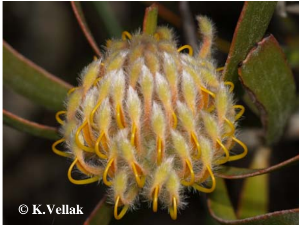
Foto 4. Leucospermum 'id on üks tüüpilisemaid põõsaid fynbosiks kutsutud kooslustes.

One of the typical bushes in fynbos – g. Leucospermum