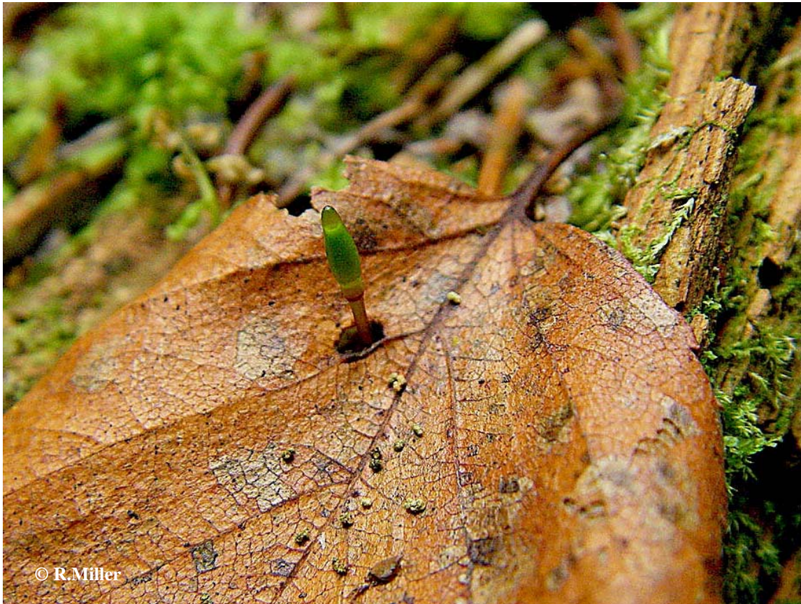
Foto 1. Väikesel samblal on suur jõud.