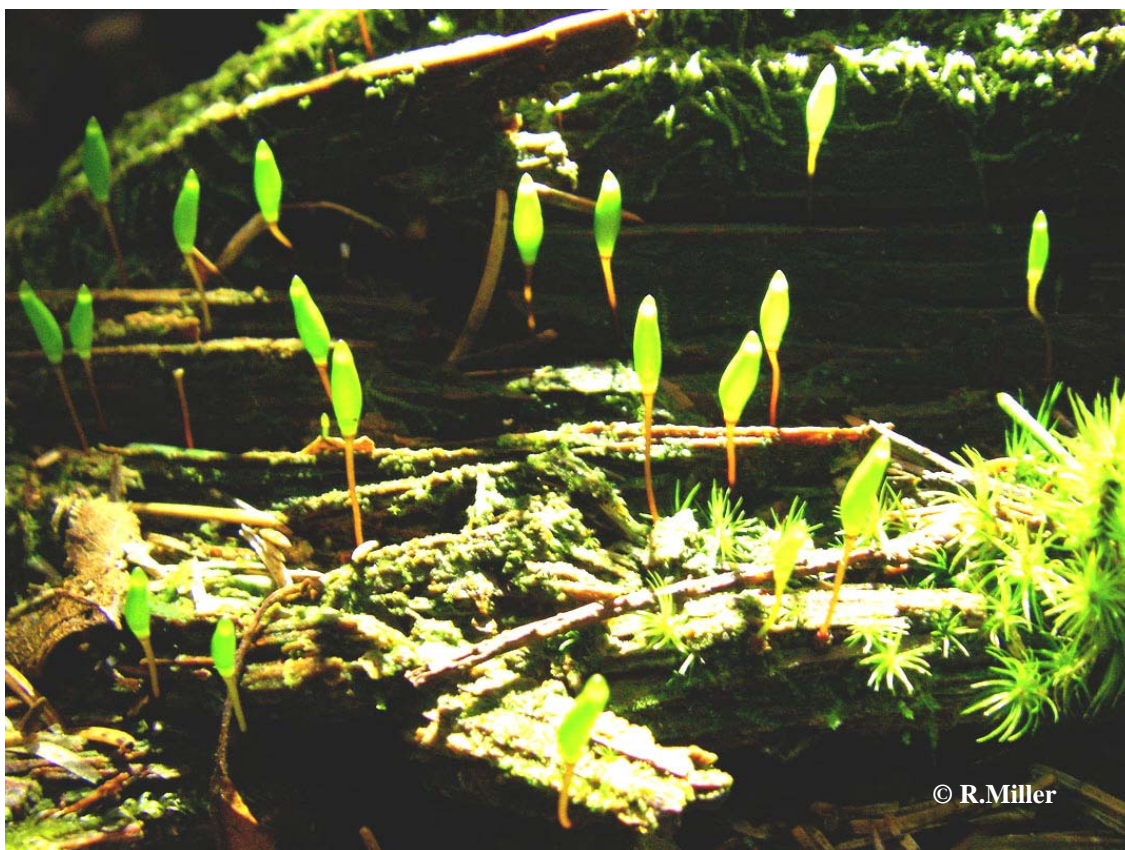
Foto 2. Detsembri kasinates valgustingimustes sai abivahendina kasutatud taskulampi. Õige nurga alt pani valgusvihk kuprad lausa helendama ja nad muutusid kergemini märgatavateks.

In December darkness a torch was very helpfull during filedworks searching for the species. Bright green capsules of B. viridis were glowled under illumination.