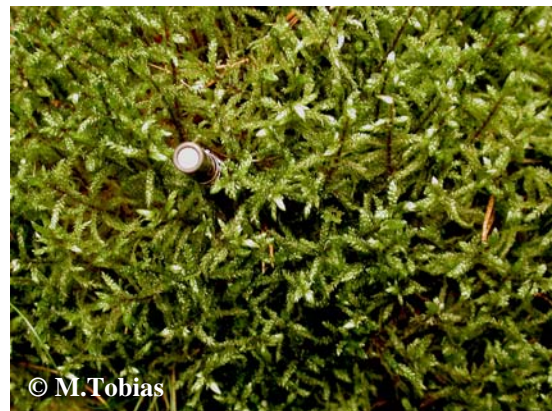
Foto 2. Näha on spektroradiomeetriga ühendatud fiiberoptilist valgustundlikku pead, mille abil mõõdeti läbitulevat valgust palusambla mati sees.

ja sammalde võrastiku arhitektuuri vaheliste seoste uurimisega. On ju valguse vähenemine võrastikus seotud võrastiku komponentide st. peamiselt lehtede, aga ka okste ja varte ruumilise jaotusega. Selle alusel peaks harunevad ja rohkelt oksti moodustavad samblad võrreldes mitteharunevate sammaldega efektiivsemalt valgust neelama. Seda seetõttu, et sama lehepinna korral lehtede ühtlasemal jaotusel neelatakse valgust enam, kui lehtede jaotus on juhuslik või agregeerunud (Niinemets & Cescatti, 2004). Samas, mida efektiivsem on valguse neelamine, seda kiiremini väheneb valguse hulk võrastikus. Kuid teiselt poolt ei pruugi väiksem valguse neelamise efektiivsus, mis tuleneb lehtede suuremast varjutamisest üksteise poolt, sugugi tähendada väiksemat fotosünteesivõimet, sest selle võib kompenseerida suurem valguse hulk, mis mitteharunevate sammalde võrastikus sügavamatesse kihtidesse jõuab.