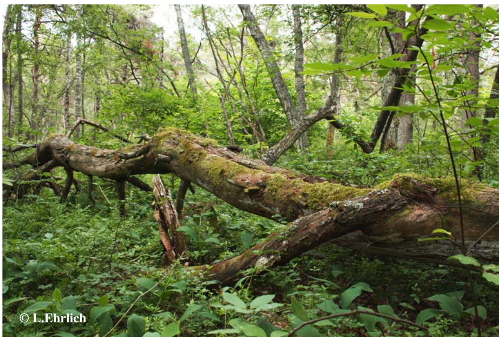
Foto 1. Laiul ohtralt esinev erinevas lagunemisastmes kõdupuit pakub sobivaid kasvukohti ka metsa vääriselupaikade liikidele.

Variety of decaying wood in Harilaid forests offer suitable habitats for several forest key habitat species.