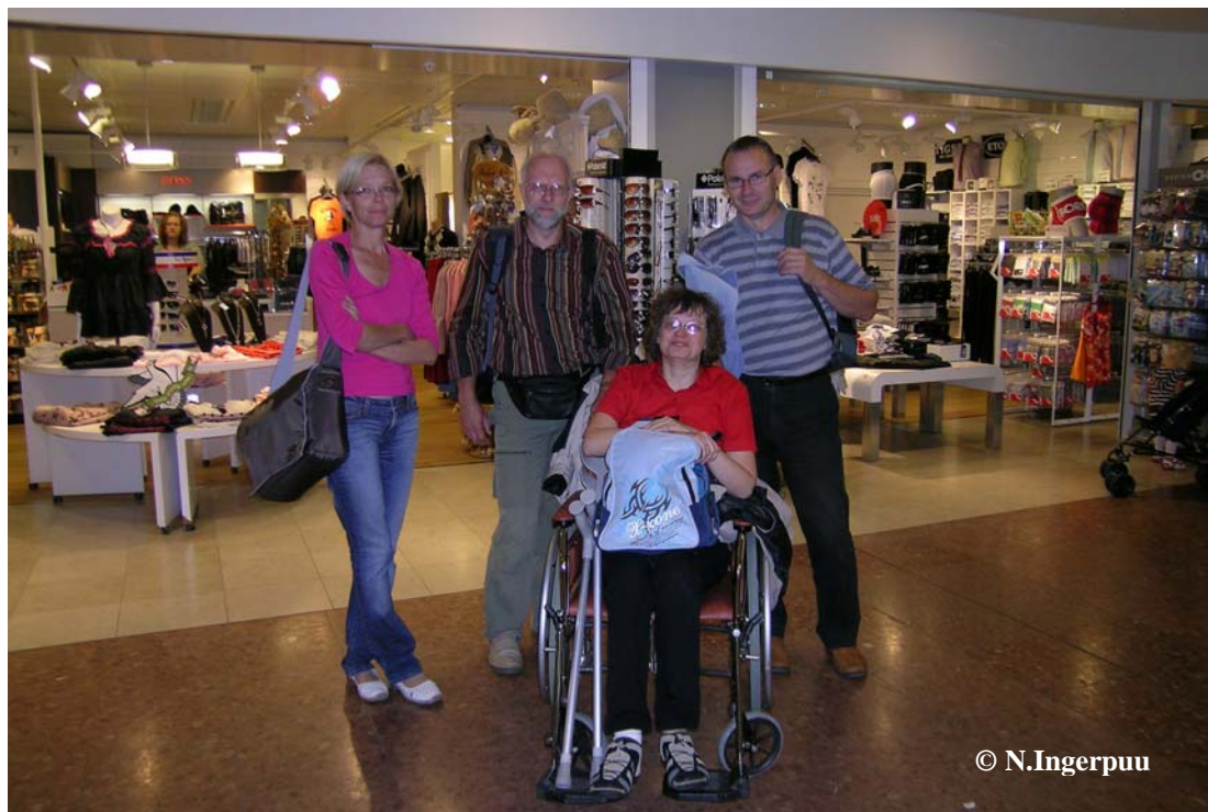
Foto 1. Reisi alguses koos "saatjate", karkude ja ratastooliga. The beginning of journey with "attendants", crutches and wheelchair.