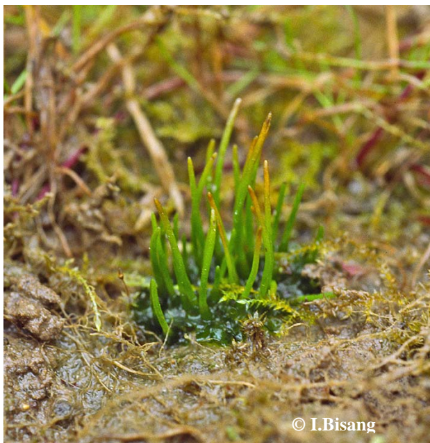
Foto 2. Phaeoceros carolinianus (Michx.) Prosk. (kollane nõelsammal).