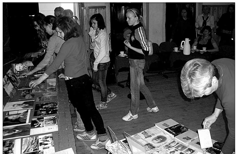
● Tammsaarele pühendatud kirjanduslikku hommikut Mõisaküla kultuurimajas ilmestas kirjandusklassiku teoste ja temaga seotud fotokoopiade väljapanek.