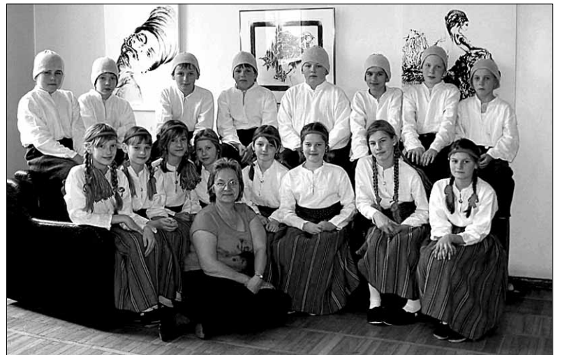
● Halliste rahvatantsurühm festivalil Tallinnas.