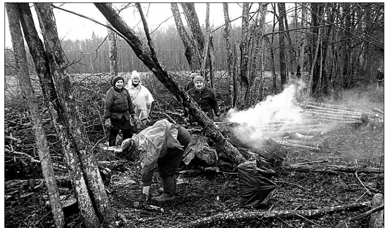
● Vihmast hoolimata tegi hulk talgulisi kunagise Pussi kooli võsastunud pargis ära tänuväärse töö.