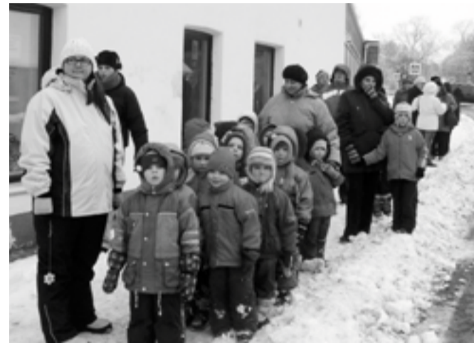
Kella avamisele tulid ka Mari lasteaia lapsed.

võiks olla torn, kuhu ta panna. 10 aastat tagasi taastati kella koht Vana-Põltsamaa linnas osas A ja O kaupluse seinal," jutustab linnapea.