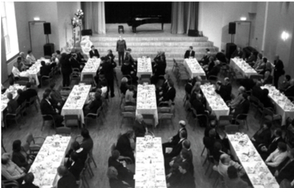
Tänuhommikusöögile oli palutud 230 külalist üle kogu maakonna ja kaugemaltki.