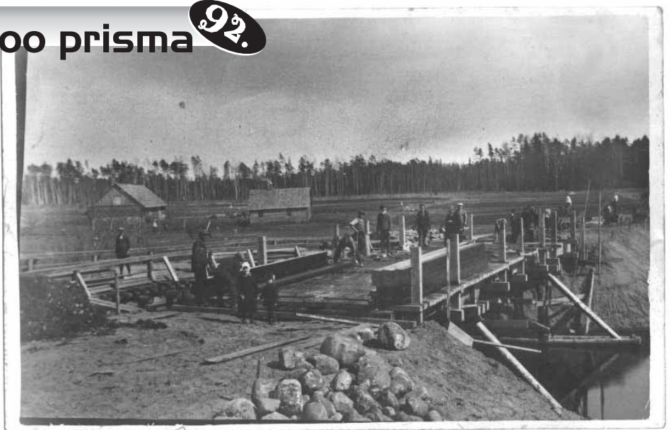
Töitaja silla ehitus 1946-1947. a.

30. aprillil korraldas Kilingi Koguduse naiskomitee "Käsitööde loterii", kus müüdi 1000 piletit a 15 senti. Võite oli 10