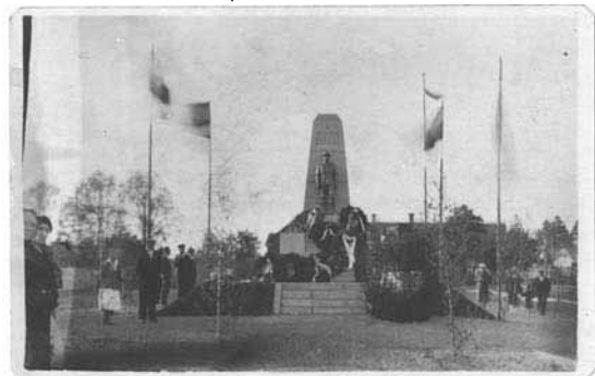
Saarde Vabadussõja ausammas 1933. aastal.

P. S. Kui kellelgi on teavet mälestusmärgi kivide või selle muude elementide kohta (ka oletused ja legendid), siis andke sellest teada telefonil 505 3592.