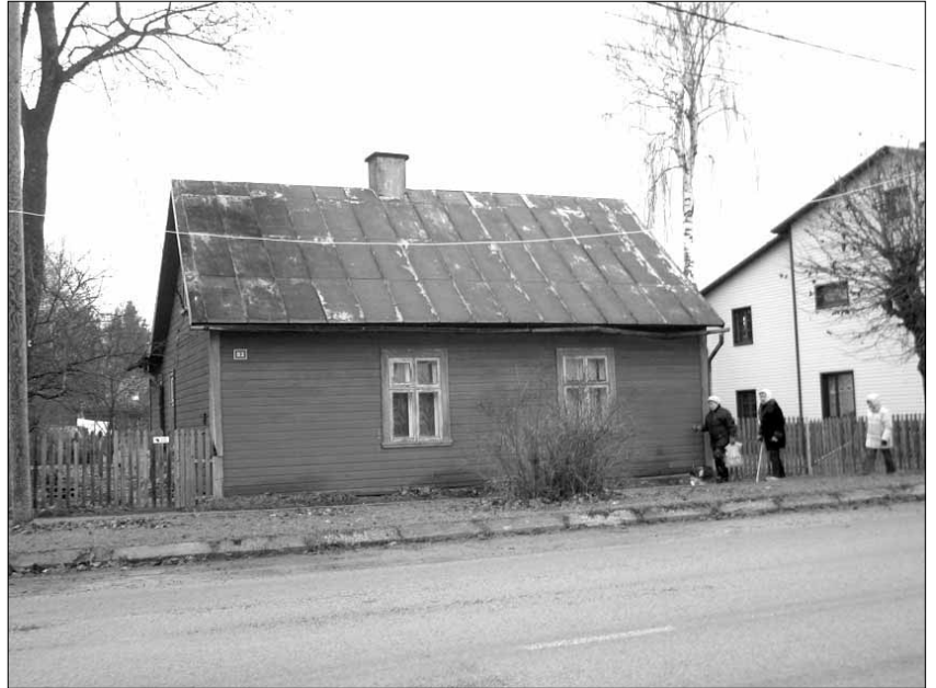
Nn lihtrahva elamu I MS eelsest ajast Pärnu tänavalt.

Levinuim on suhteliselt väike, viilkatusega puitelamu, kus üldjuhul katusekorrus väljaehitatamata. Tagasihoidlik hoonetüüp levis eelkõige pea-