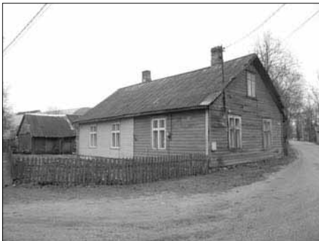
Järve 2 paarismaja.

dad või isegi avatud eeskojad, mis omelt olid ajastu väikeelamutele iseloomulikud nii maal kui linnas. Katusealune on kasutusel külma pööninguna, sinna viib maja otsaviilul paiknev laudadest luuk. Välisilme järgi otsustades võib rääkida isegi tüüpprojektidest. Tegemist on Kilingi-Nõmmele väga iseloomuliku hoonetüübiga, mille massiline säilimine veel 21. sajandil on Euroopa kontekstis küllalt unikaalne.