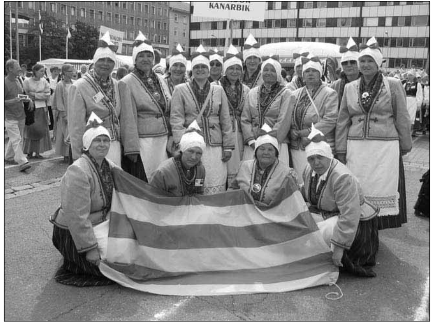
"Kanarbik" uutes kuubedes - Saarde rahvaröivastes.

Laulupeo korraldasid Soome Lauljate ja Mängijate Liit (Sulasol) koos soome-rootslaste ning Eesti muusikaorganisatsioonidega. Lauldi nii eesti, soome kui rootsi keeles. 3-päevane programm sisaldas võistulaulmise, pargi-, tänava- ja kirikukontserte, esinemisi Pori ja ümbruskonna saalides, festivaliklubi, ja muidugi peaproove, avatseremoonia, rongkäigu ja laulupeo peakontserdi. Laulupeo teatmikust võib lugeda, et osales 240 kollektiivi.