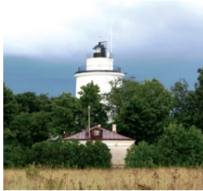
Tuletornid on kinnistunud Suurupi paikkonna iseloomulikeks tähisteks. 1760. aastal valminud Suurupi ülemisel tuletornil on kõrgust merepinna 66 m ja torni jalamil 22 m. Tule nähtavuskaugus on 18 miili.