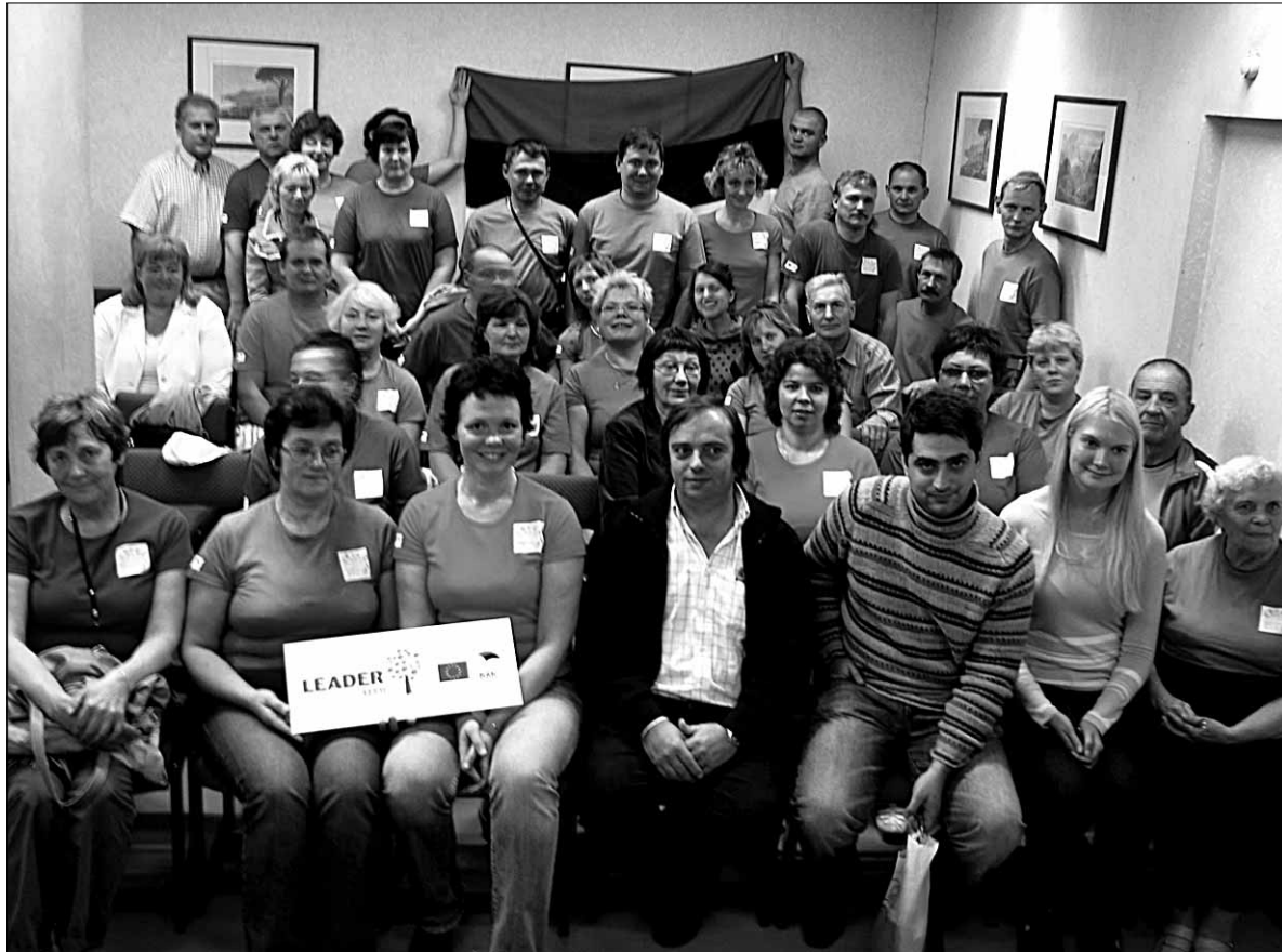
• Mulgimaa Arenduskoja liikmed koos võõrustajatega seminaril Madeiral.

Tihti kuulame inimesi ütlemas, et Madeira on nii erinev võrreldes Eestiga. Sugugi mitte, Portugal ja sealhulgas Madeira on üks Euroopa Liidu äärmisi piirkondi nagu ka Eesti ja mõlemad me peame tegema suuri pingutusi, et jõuda samale tasemele Euroopa Liidu ülejäänud piirkondadega.