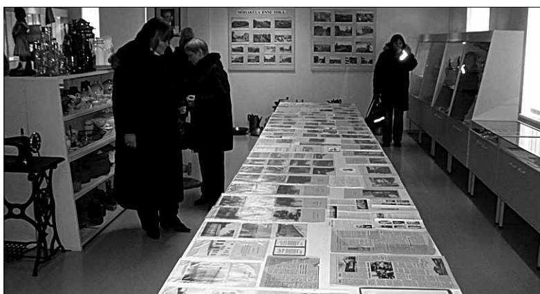
● Muuseumiaasta hakatuseks saab Mõisakülas veebruari lõpuni vaadata Eve Raska koostatud ulatuslikku näitust Kamara küla ajaloo kohta.