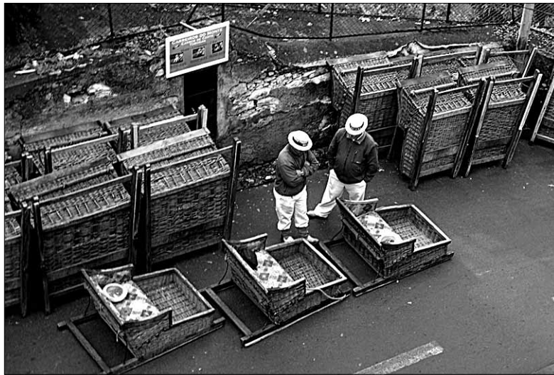
• Selliste keldudega, nagu on näha pildil, harrastatakse Madeiral jalgadega juhtides kelgutamist asfaltrajal.

Acaporama LEADER-tegevusgrupi üheks tegevusprioriteediks on looduskeskkonna säilitamine ja inimeste