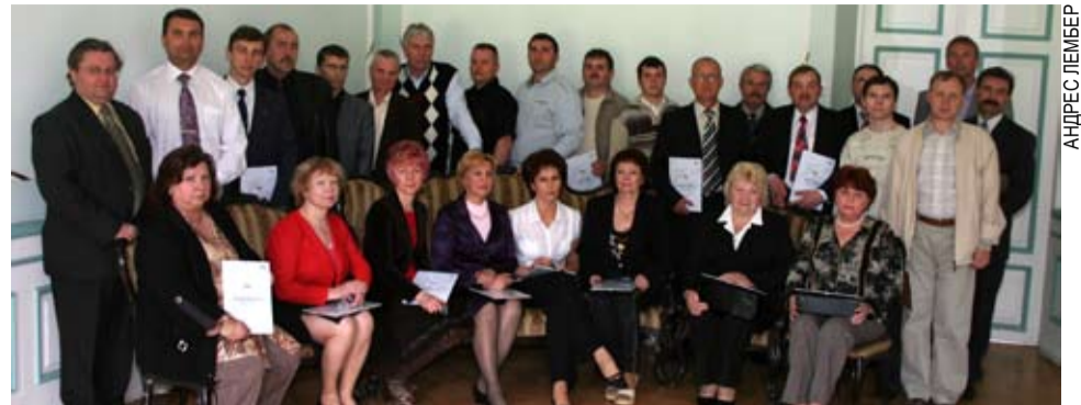
Работники со стажем из Восточного региона на приеме на мызе Мязтагузе.