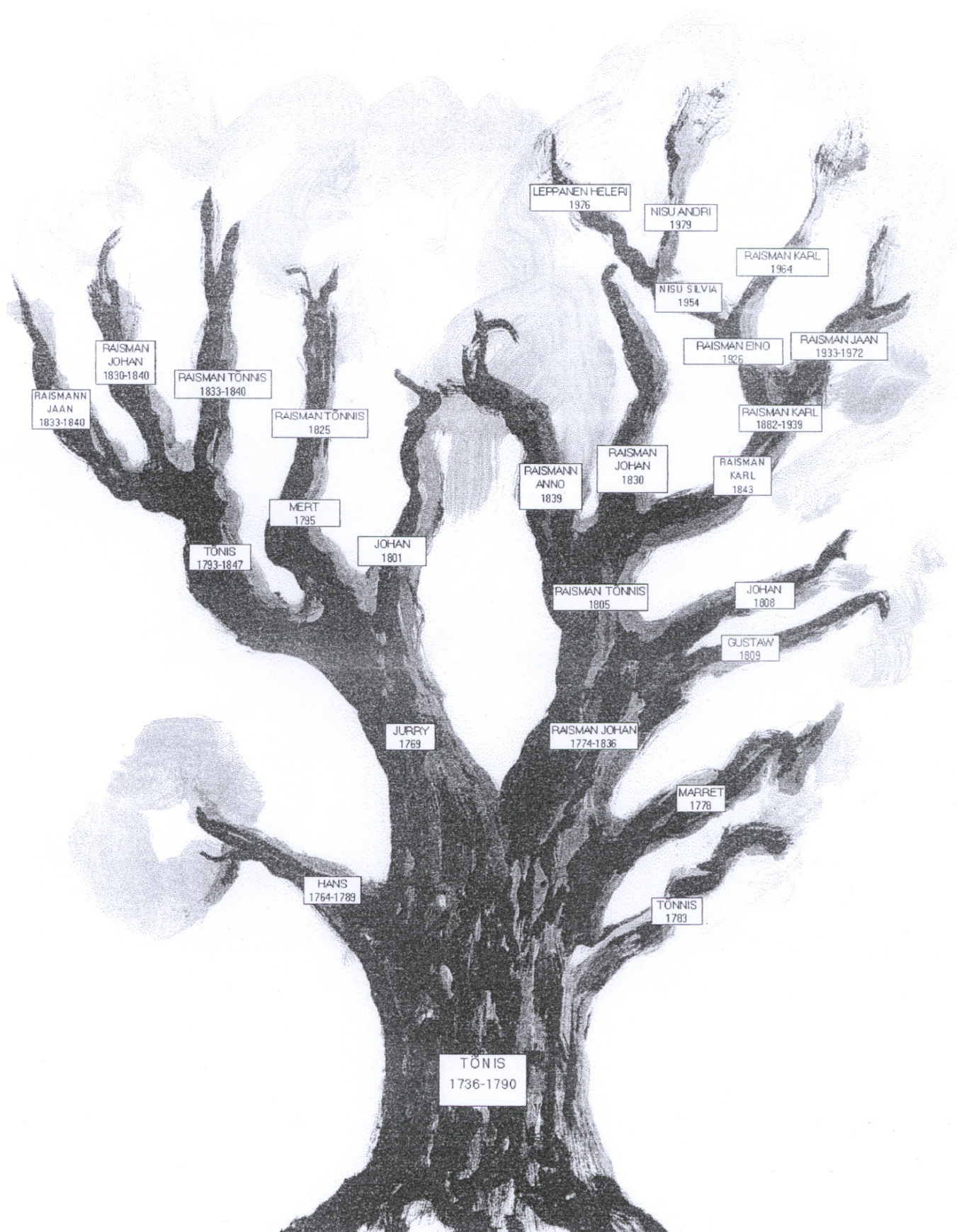
Tiina Tafenau emapoolne sugupuu