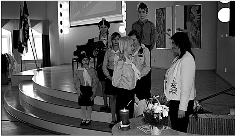
● Eesti Vabariigi aastapäevaaktusel Halliste Põhikoolis andis pidulikult vandetootuse kolm uut kodutütart.

Eesti Vabariigi 92. aastapäeva tähistamiseks toimusid Abjas, Hallistes ja Mõisakülas pidulikud kontsert-aktused. Meenutati möödunud, austati vabaduse eest võidelnud ja mälestati langenuid ning tunnustati tänaseid tublisid inimesi.