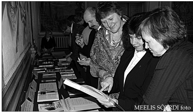
● Abja kultuurimajas pakkus elavat huvi väljapanek, mis tutvustas Abja-le kuulsust toonud ühendusi ja inimesi läbi aegade, kel tänavu tähtpäev.