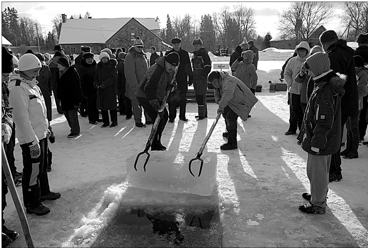
● Jääskulptuuride valmistamiseks saeti järvejääst esmalt välja paraja suurusega tahukad ja sikutati need pootshaakidega jääaugust välja.