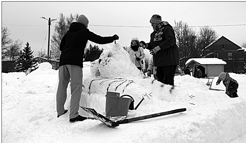
● Lõppeval lumeküllasel talvel valmis Mõisakülas bussijaama esisele haljasalale väikelinna esimene lumelinn.