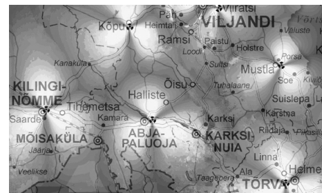
○ väga hea levi ● hea levi ● keskmine levi

Viimasel ajal on tulnud turule väga erinevaid traadita interneti lahendusi, mille seas on sageli raske õiget valikut teha. Eesti Energia poolt pakutav KÕU internet on mitmes mõttes parim lahendus. Lisaks sellele on KÕU internetil Lõuna-Mulgimaal parim levi.