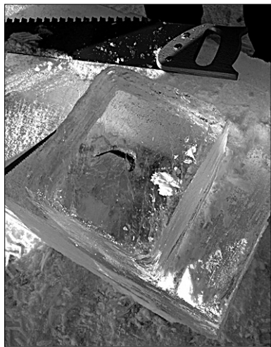
● Võiduskulptuur – külmunud kalake säravas jäises "mausoleumis".

Mõisaomanike meeskonna jääskulptuur kujutas sümboolset Siversite laeva. Teatavasti oli Õisu esimene mõisahärra admiral Peter von Sivers tsaar Peeter I laevastiku ülem.