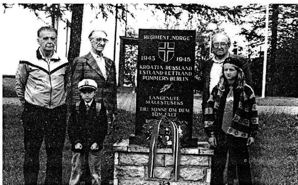
Mälestussammas Sinimägedel Norra vabatahtlikele, kes aitasid hoida Eestit ja Euroopat veel pool aastat langemast Vene terroristide ikkesse

Kurb kogu selle loo juures on see et "hääli kommunistile" ei ole paljude eestlaste - ka Siberi läbiteinutele - kuritegu eesti rahva vastu.