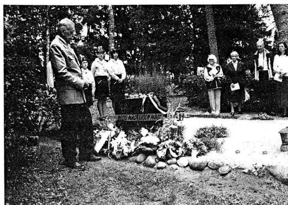
Sakala Kodutütarde ringkonna vanema haul Karksi-Nuia Rahumäe kalmistul, mälestuskivi avamine juuli 2007

"Tule taevas appi", esikommarit Ansipit tsiteerides. Oleme ise süüdi et vabatahtlikult vanglasse läksime, Siberisse läksime. Jah, kommarid saavad seda isegi tõestada. Iga vene ajal vanglasse viidud kirjutas oma käega "Tulin vanglasse nr (järgnes vangla number) sel ja sel kuupäeval. Kes vabatahtlikult ei kirjutanud tulin, vaid proovis kirjutada toodi, sellelt kõige otsesemalt peksti välja sõna tulin.