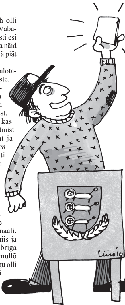
PLATSI LIISO TSEHKENDÜS

Naksi Haani poolõ jalotama. Peräle jõudsõ häste. Kõgõpäält lätsi vallamajja. Sääil istsõva lavva takah kolm vai nelvi ilosat naistõrahvast. Teredi ja küsse, et kas siin ma saa umma tahtmist täütä. Üteldi, et saat ja küsti paprit ( isikut tõendav dokument ). Võti rahakoti vällä ja naksi passi otsma. Ja määne jama. Olli kodo unõhtanu. Mitu üüd es olõ maganu. Esiki üüse mõtli, kedä tulõ valli. Viimäne õdak inne valimiisi sei sisse puul õllõklaasi luminaali. Kadonu esä olf jahimiis ja timä pandsõ tuu pulbriga rebäsidi magama. A mullõ es tii midägi. Hummogu olli niivõrd uninõ, et es olõ meeleh paprit ütch võtta. Rahakotih olf külh pangast raha vällä võtmisõ papõr numbriga. Tetti selges, et tuu nummõr ei kõlba. Lõudse viil ütch är kraabidu telefoni Simpeli kaardi. No mis sa kurat ütlet – toda nummõrd kah es taheta. Miil läts nii kurvas, et astõ vällägi är. Sis näi, et ütch kodusõpääline