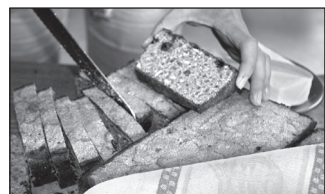
Esitett leib.

Kutsumi ka noid, kel om midägi muud umatettüt leevä kõrvast, kas võidu, sõira vai suidsulihha. Oodami kõiki häid mõttit. Kõnõlda ja küsüdä saat numbri 505 6297 päält.