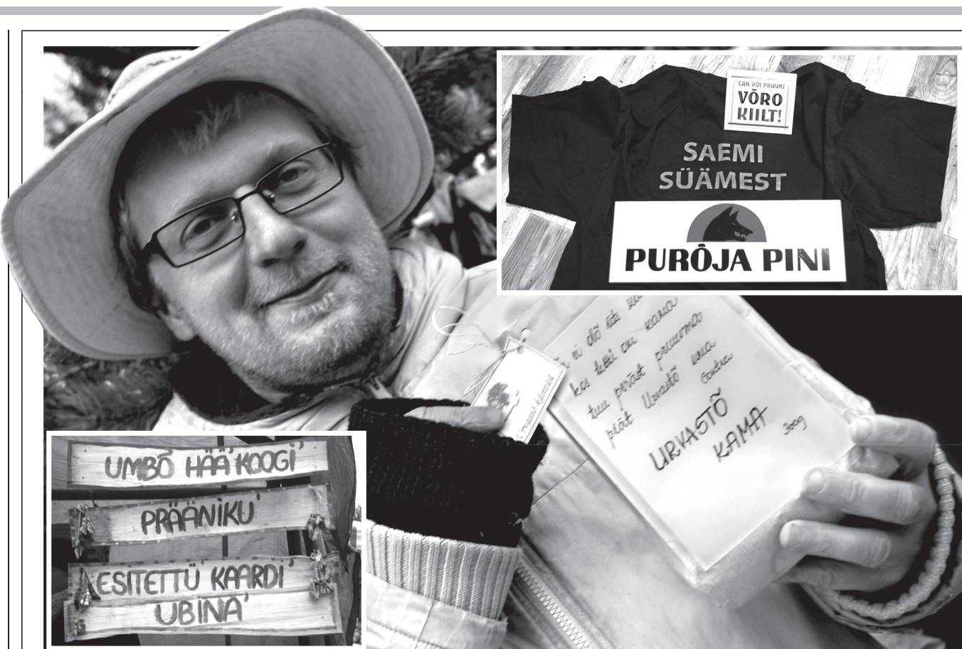
HARJU ÜLLE PILDI

Vennikase Pillel aigu om: täl es olõ hallõ 14 tunni aigu är pruuki, et 100 kilomiitret jalaga läbi saia.