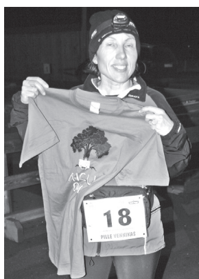
LEOLA KÜLLI PILT

Vennikase Pillel aigu om: täl es olõ hallõ 14 tunni aigu är pruuki, et 100 kilomiitret jalaga läbi saia.