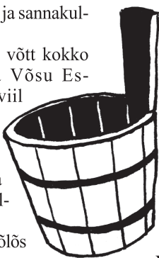
PLATSI LIISO TSEHKENDÜS

Savvusanna-kõnõ- luisi vidävā iist Vöro- maa kutsõhariduskes- kus, Tarto ülikooli kul- tuuritiidüisi ja kunstõ instituut ja Vöro selts VKKF.