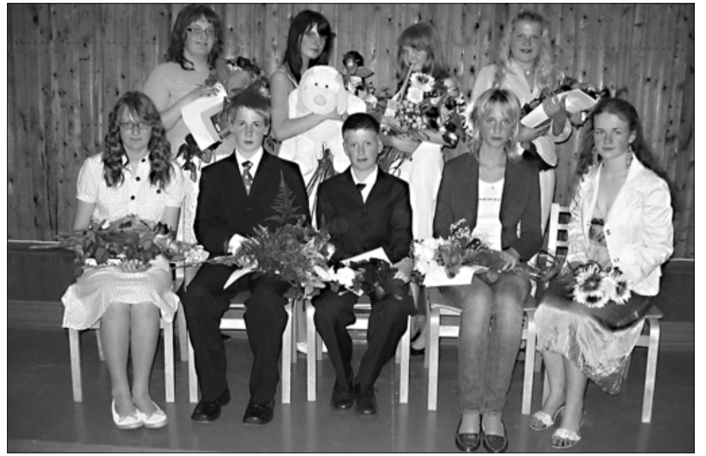
Tapa muusikakooli sellekevadised lõpetajad.