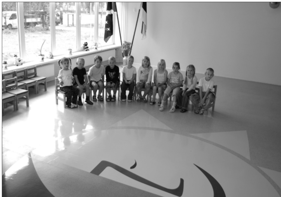
Lasteaia Pisipõnn lapsed värvilõhnalises ja värskest remonditud saalis, mille põrandale on maalitud päike, kuu ja tähed. Lasteaias antava alushariduse kvaliteedist sõltub paljuski laste edukus päris koolis.