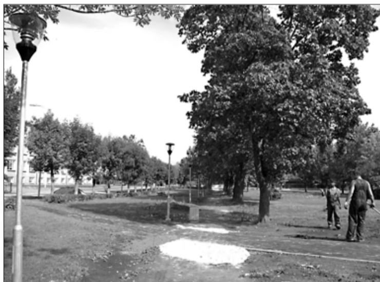
Koolimaja vastas asuv park sai kooliaasta alguseks uue ilme.

Õpetajate töö on aastate jooksul muutunud aina raskemaks ja seda just lapsevanemate hoolimatu suhtumise tõttu lapse õppeprotsessi. Tahan siinjuures tuletada igale lapsevanemale meelde, et ikka rohkem tunneksite huvi, kas teie laps käib igas päev koolis ja kõigis tundides? Olege kursis ja tundke huvi kuidas teie lapsel koolis läheb. Raha keeles rääkides maksab koolipäev valla jaoks 125–150 krooni õpilase kohta