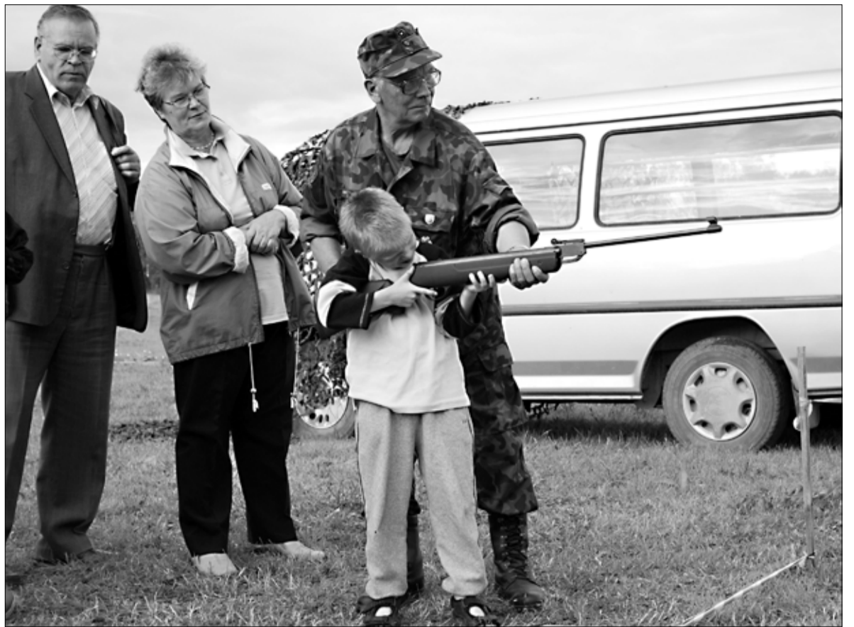
Perpäeval osalejad said proovida oma täpsust ka püssist laskmises.