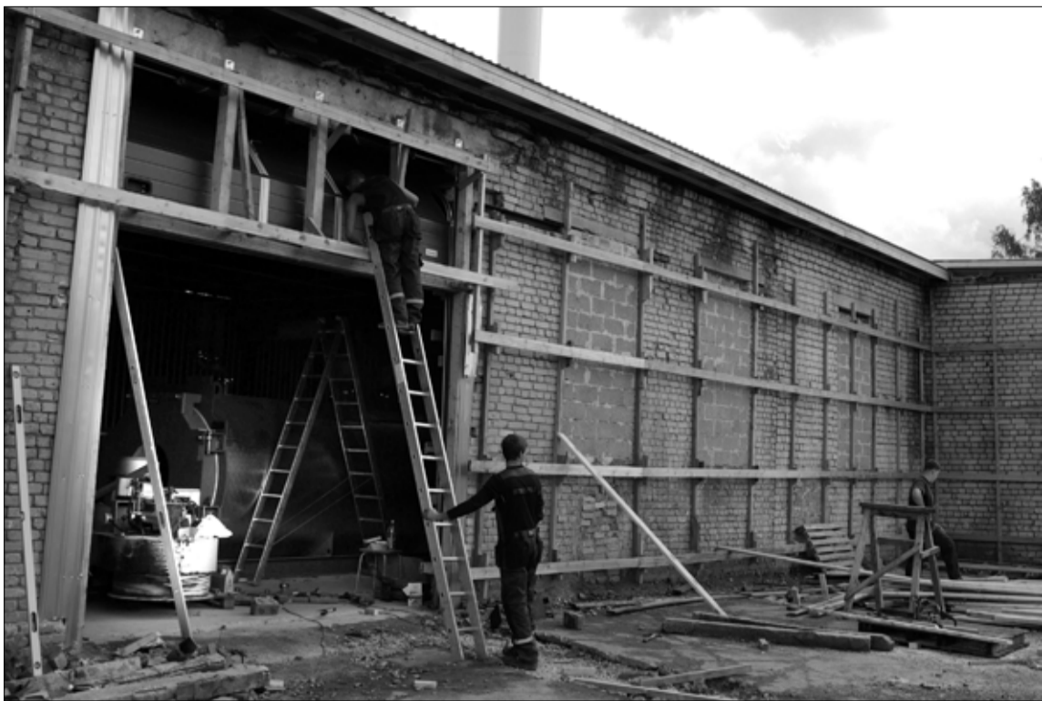
Üleviste tänava uue katlamaja juures käisid augusti lõupäevadel hoogsad ehitustööd.