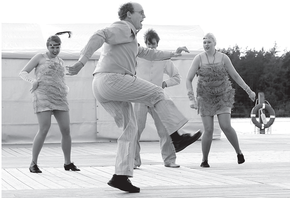
Swingtants Tartu tantsuklubi Swingiring esituses.

“Elvas oli mul pärast aastast beebipausi esimene õpetamine, väga hea tunne on jälle tantsida,” rääkis uudse tantsustiili eestveda-