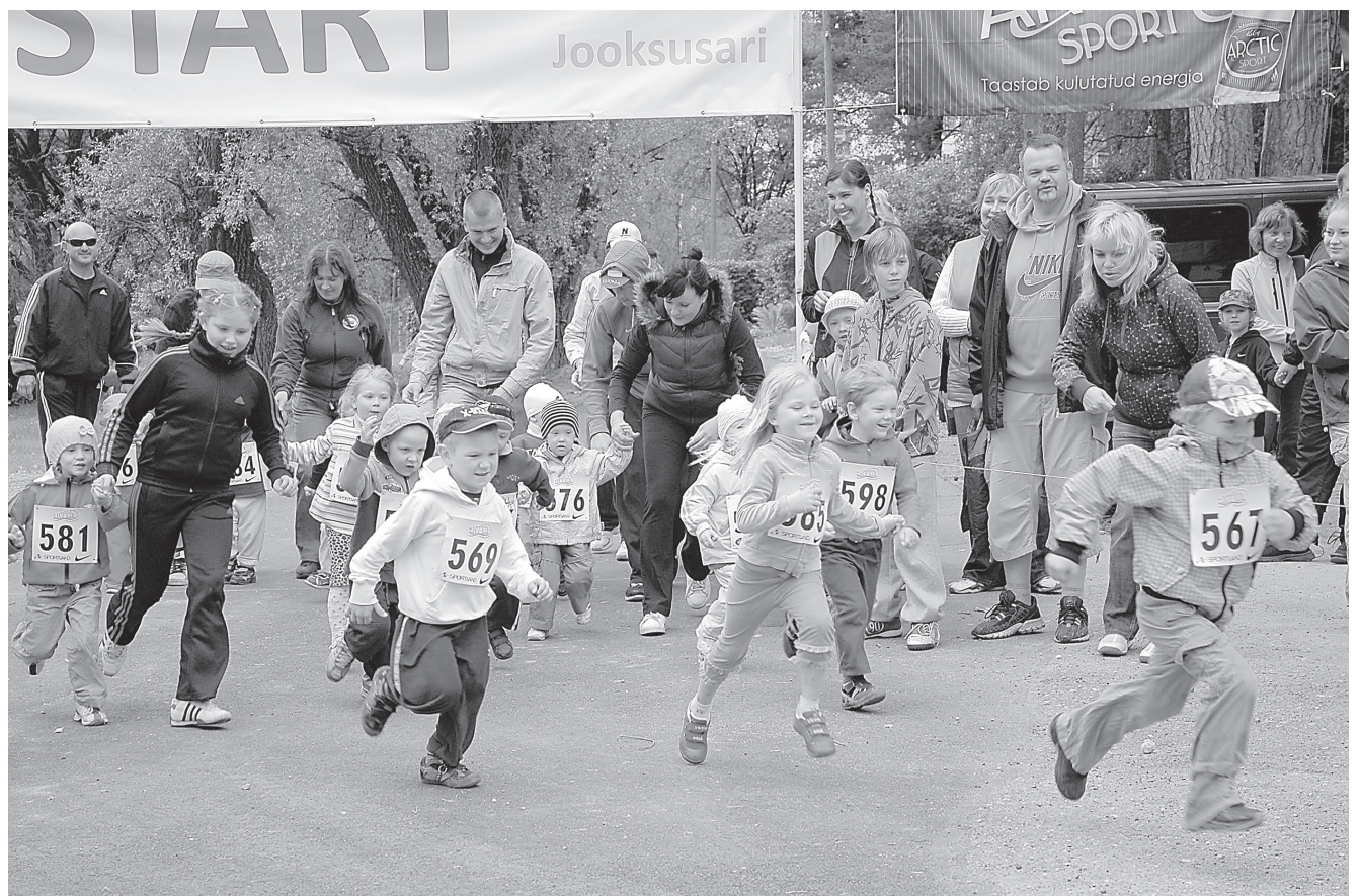
Laste vanuserühmade arvestuses läks kõige väiksemaid jooksjaid rajale kõige rohkem.