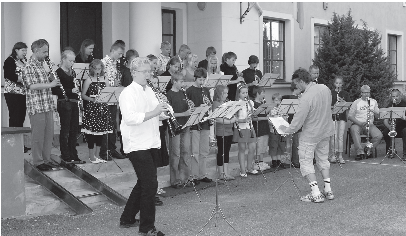
2008. aasta klarnetisuve lõpetas kontsert raekoja trepil.